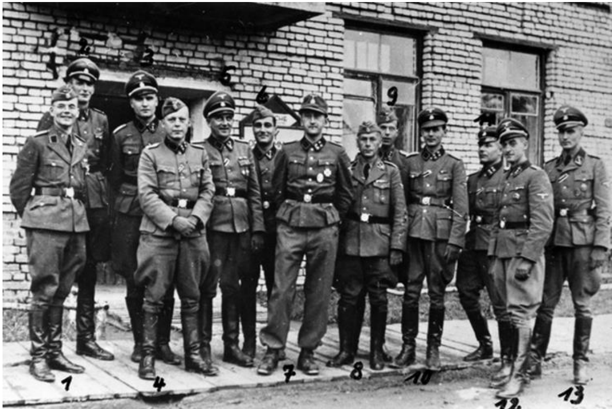
Een van de vele gruwelijke SS-Einsatzgruppen lachend op de foto.