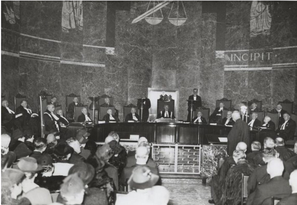
Zitting van de Hoge Raad in nazi-Duitsland

Voor doodslag was die periode vijftien jaar 'na de dag dat de misdaad was gepleegd'. Voor moord was het twintig jaar. In de praktijk betekende dit dat het na 1960 vrijwel onmogelijk zou zijn om een voormalige SS'er aan te klagen voor doodslag in verband met de Holocaust en voor moord. Na slechts zeven jaar hoefden zelfs de ergste massamoordenaars niet langer bang te zijn voor vervolging [..].