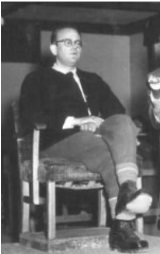
Bloedrechter Konrad Morgen

In mei 1957 publiceerde het Oost-Duitse regime een lijst van 'bloedrechters' die het naziregime hadden gediend en nu hoge posities bekleedden in West-Duitsland. Het was het begin van een campagne die ingreep op wat een wetenschapper de 'achilleshiel van de pogingen van West-Duitsland om nazimisdaden te bestraffen noemde: het feit dat zoveel rechters die deze processen voorzaten, loyaal hadden gediend onder het Hitlerregime [...]. De eerste lijst werd snel gevolgd door onthullingen die honderden [...] andere West-Duitse rechters in verband brachten met het Derde Rijk.