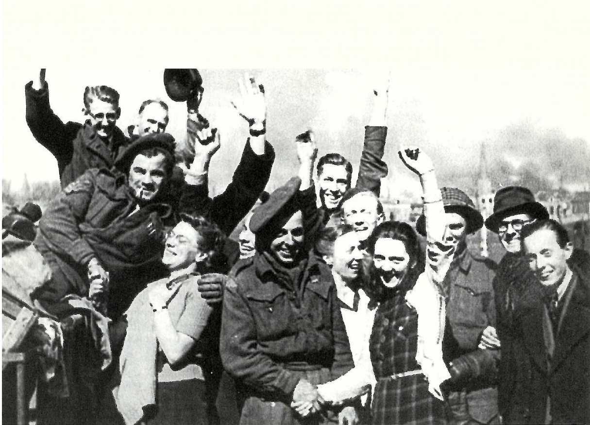
Zutphen bevrijd, de Glens op de Hobbemakade.