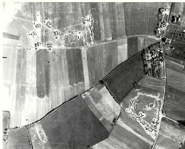
Luchtfoto Leesten gemaakt tijdens een Canadese verkenningsvlucht op 7 april 1945. Duidelijk zichtbaar zijn de loopgraven (rechtsonder) en restanten van een luchtafweerstelling (linksboven) van de Duitse tegenstand.