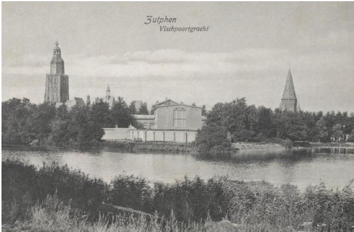
Huis van Bewaring in Zutphen

Vervolgens krijgen de SD-mensen de opdracht vier personen in een auto te laten plaatsnemen en daarmee naar de IJsselkade te rijden. Hijzelf rijdt eerst nog de IJsselkade af om voor zijn motorfiets een geschikte parkeerplaats te vinden.