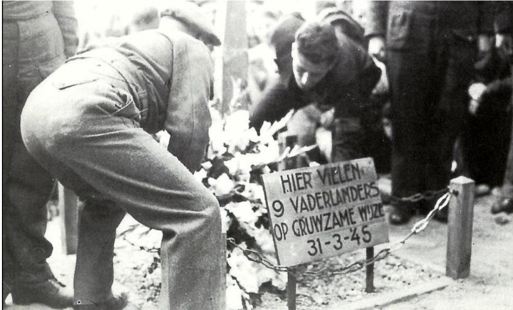
Kranslegging IJsselkade op plaats waar de gevangenen zijn gefusilleerd, 1945.

HIER VIELEN 9 VADERLANDERS OP GRUWZAME WIJZE 31-3-45