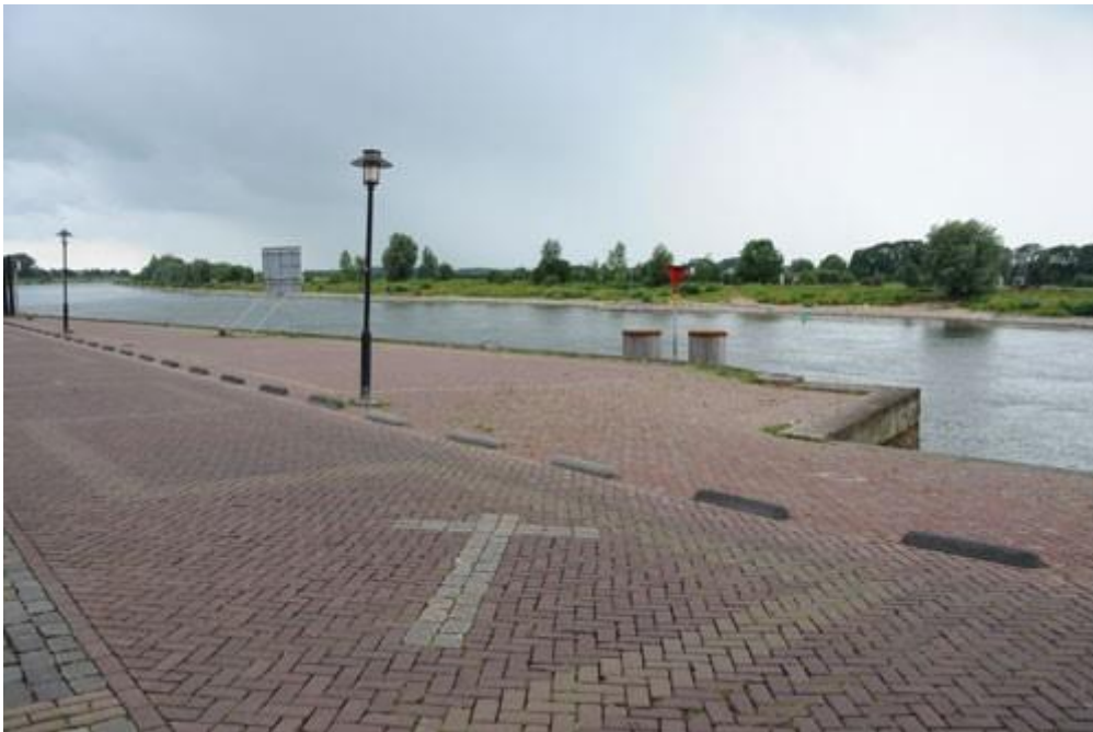
De IJsselkade met de plaats waar de executies plaatsvonden

Kort voor de Bevrijding, april 1945, zijn in Zutphen nog dertien mensen dood geschoten. Vier van hen in de buurt van het Huis van Bewaring, de andere negen op de IJsselkade.