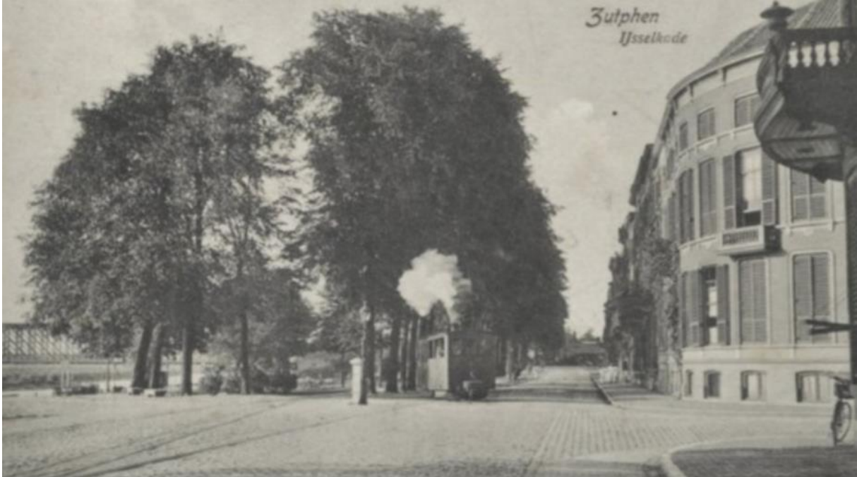
De IJsselkade, voor de oorlog. Aan de linkerkant de kade waar de executie plaatsvond