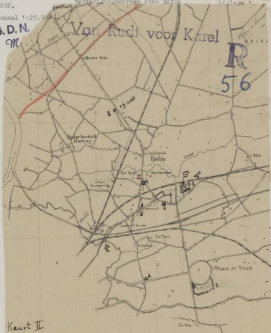
Kaart II schaal 1: 25000.