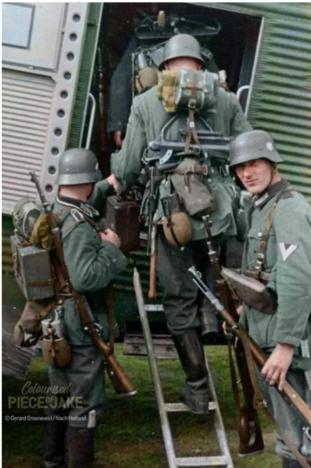
Soldaten van de 22e Luftlande-Divisie gaan aan boord van een Ju-52 voorafgaand aan de Duitse inval in Nederland (Operatie Fall Gelb), Münster, 10 mei 1940.

Hoeveel Duitse vliegtuigen werden beschadigd of neergeschoten tijdens de inval in Holland?