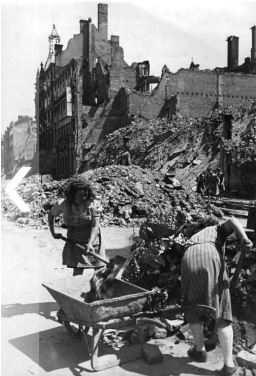
De z.g. trümmerfrauen

Ook de wederopbouw van de economie was een factor - de Britse zone ontdekte bijvoorbeeld dat 90% van de advocaten op de een of andere manier gelieerd was aan de nazi's. Strengere ontnazificering zou het land zonder voldoende gekwalificeerde professionals achterlaten om te functioneren.