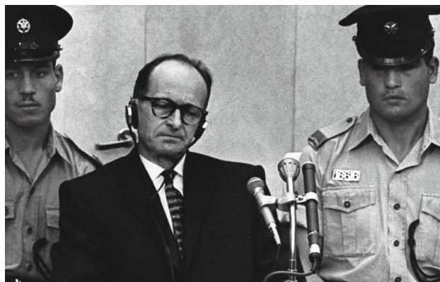
In 1960 werd SS-kopstuk Adolf Eichmann gevangen genomen in Argentinië. Hij werd later in Jeruzalem berecht en ter dood veroordeeld.

Maar velen ontsnapten aan de verdiende straf, een spijtige en harde waarheid over dit uiterst duistere hoofdstuk in de menselijke geschiedenis.