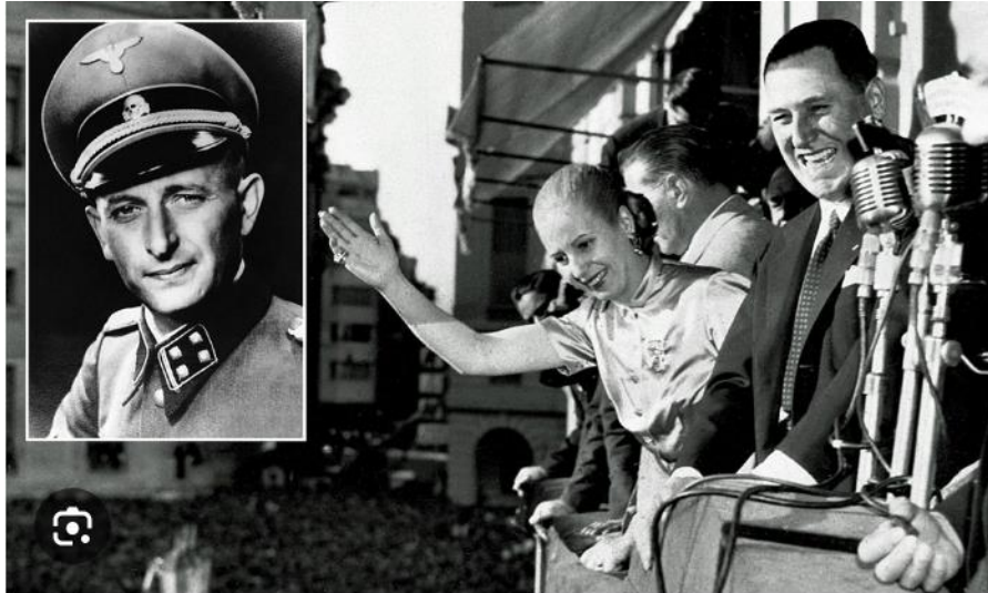
Juan Peron met zijn vrouw Eva en de oorlogsmisdadiger Eichmann, die met open armen werd ontvangen

De beruchte Neurenberg-processen vervolgden alleen de meest prominente leiders, en resulteerden desondanks slechts in 12 doodvonnissen in vergelijking met de miljoenen doden van de Holocaust. Sommigen bekritiseerden deze processen als "overwinnaarsjustitie".