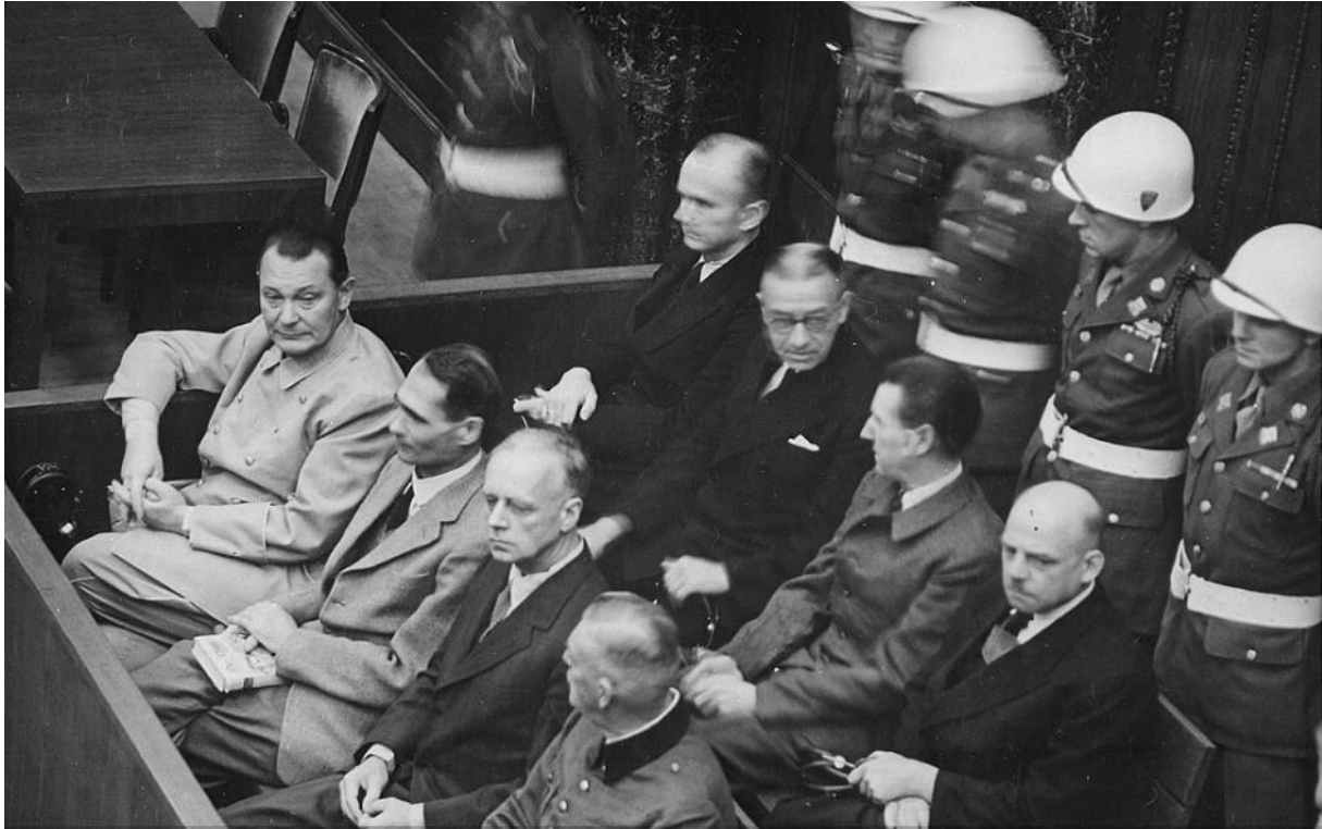
De Neurenberg processen tegen de top van Nazi Duitsland