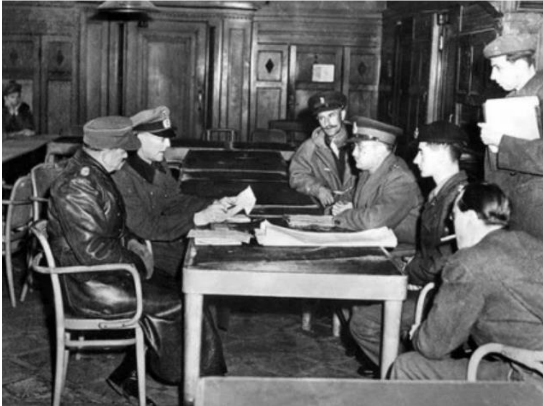
Wageningen, 5 mei 1945: v.l.n.r. Reichelt, Blaskowitz, Kitching (chef-staf), Foulkes, Molnar en prins Bernard.