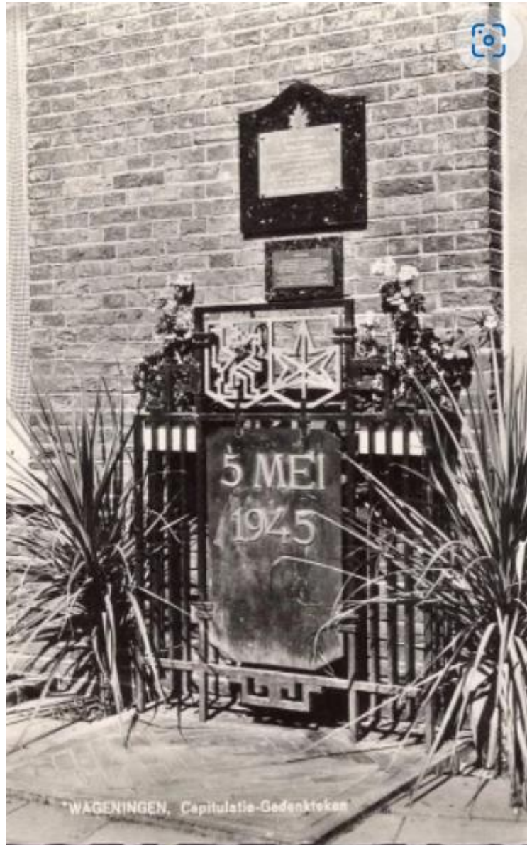
Capitulatiegedenkteken 5 mei 1945

een capitulatie en daarom ten onrechte een rijksmonument. Een capitulatie is geen feit als bij een in zo'n situatie normale vraag bevestigend wordt geantwoord. Zo werkt de procedure van een implementatie van een capitulatie document niet.