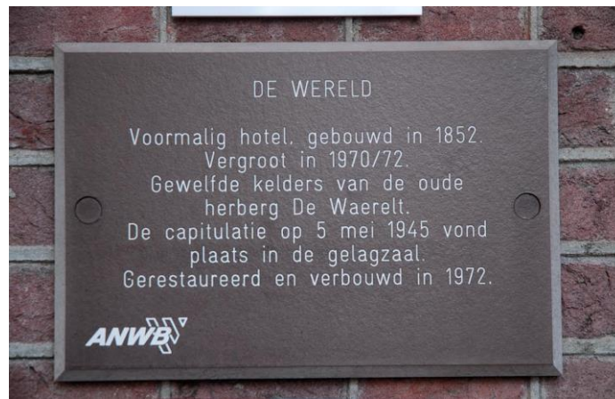
Plaquette aan de muur van hotel 'De Wereld'

Wageningen Stad der bevrijding is gebaseerd op een taaie geschiedvervalsing. De oorlogshandelingen in heel Nederland eindigden zaterdag 5 mei 1945 om 08.00 uur. In Wageningen waren geen onderhandelingen over een capitulatie of capitulatievoorwaarden. Een 'Duitse capitulatie' was onmogelijk omdat de Geallieerden de Duitse regering niet erkenden. 'Capitulatiezaal' is een geschiedvervalsing omdat in dat hotel geen capitulatie heeft plaatsgevonden.