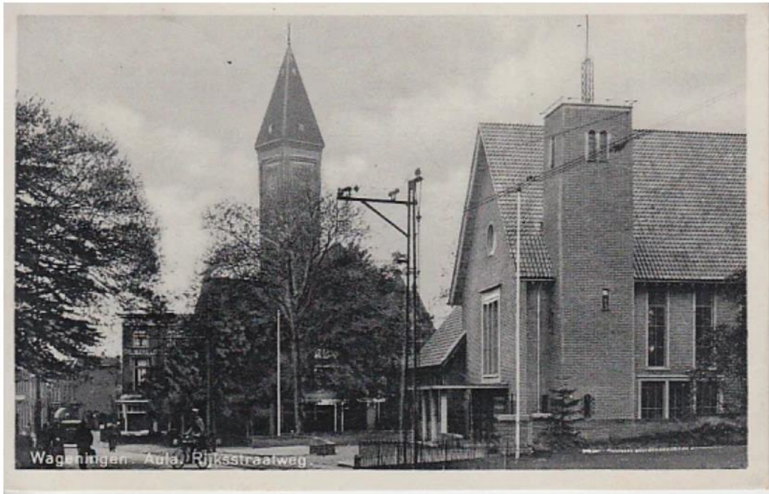
Wageningen, Aula, 1940

Die bevond zich in boerderij Noda aan de Nude tussen Rhenen en Wageningen. Hij moest immers de eveneens met een dag uitgestelde Brits-Canadese opmars naar het westen van Nederland voorbereiden. De Britten zouden 7 mei het gezag over het gebied tussen het IJsselmeer en de Lek van Duitse troepen overnemen; de Canadezen over het zuidelijke deel van Zuid-Holland.