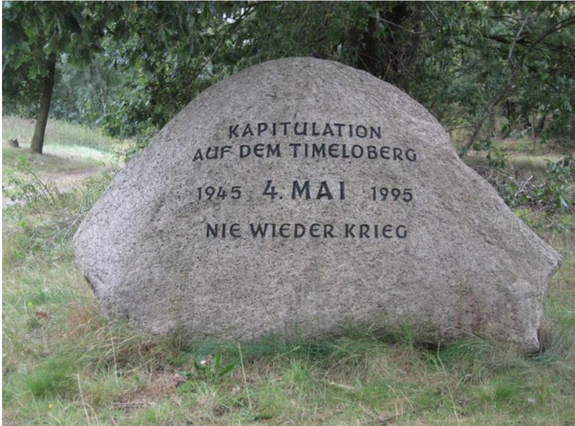
Herinneringssteen op de Timeloberg op de Lüneburger Heide op de plek waar ooit de leger tent stond van veldmaarschalk Bernard Montgomery waarin de capitulatie werd ondertekend.

Op dat tijdstip van inwerkingtreding van de capitulatie op de Lüneburger Heide was de Tweede Wereldoorlog in die gebieden afgelopen. Nederland was vrij en viert daarom 5 mei Bevrijdingsdag; althans historisch gezien.