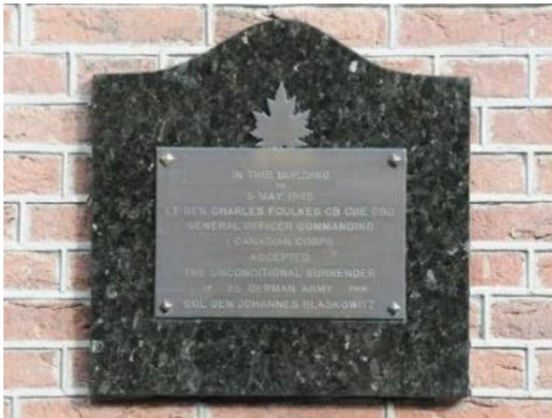
Plaquette ter herinnering aan de acceptatie door generaal Foulkes van de onvoorwaardelijke capitulatie van 25. Armee door generaal Blaskowitz.

Het museum baseert Wageningen Stad der Bevrijding en Vrede van Wageningen 1945 op mythen over 5 en 6 mei 1945. Een museum behoort geen geschiedvervalsing, maar juiste historische informatie te verschaffen.