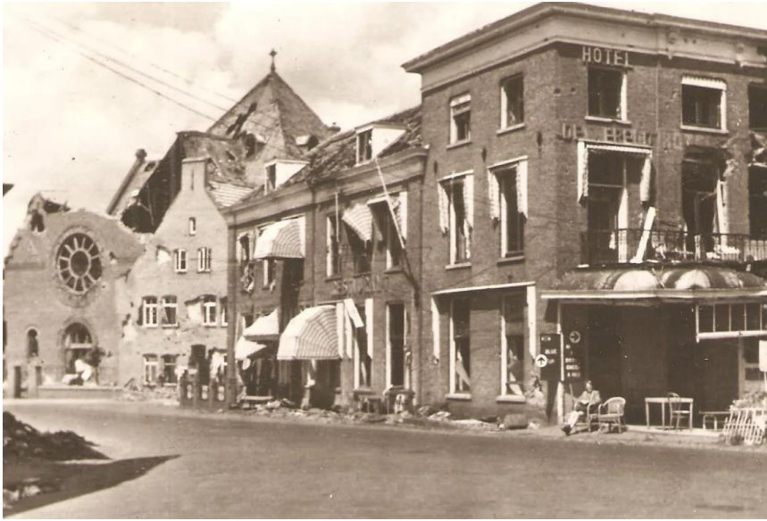
Hotel 'De Wereld' 1945

Die arriveerde precies op tijd bij Hotel 'De Wereld'. In de gelagzaal waren lange tafels neergezet met aan weerszijden stoelen voor beide delegaties. Langs de wanden stonden stoelen voor persfotografen, oorlogscorrespondenten, cameramensen en officiële toeschouwers.