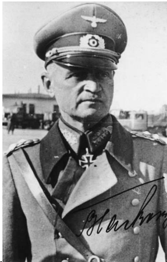
Generaloberst Johannes A. Blaskowitz

capitulatie op de Lüneburger Heide formuleerde Foulkes de overgavebevelen (Orders on the Surrender). Onderhandelen over een onvoorwaardelijke capitulatie of overgavebevelen was uiteraard onmogelijk.