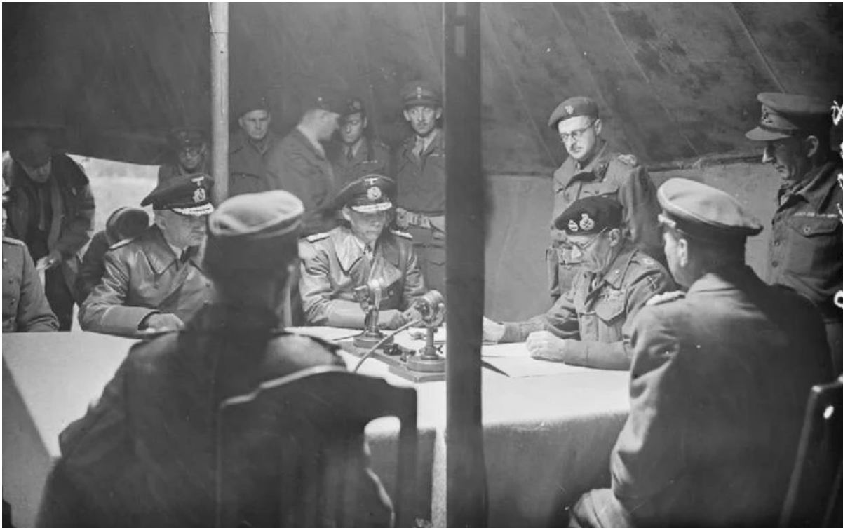
Ondertekening van het capitulatie document op de Lüneburger Heide

Door dr. Jan Brouwer, 11 april 2015, Historiek