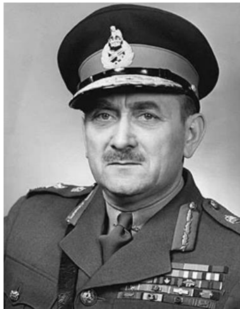
Luitenant-generaal Charles Foulkes

Velen verwarren het capitulatiedocument van 4 mei 1945 met de overgavebevelen ('Orders on the Surrender') van 5 mei 1945. Die bevelen dienden ter implementatie of uitvoering van het capitulatiedocument. De artikelen 3 en 4 van het Instrument of Surrender schreven voor dat de gecapituleerde troepen alle verdere Geallieerde bevelen moesten uitvoeren.