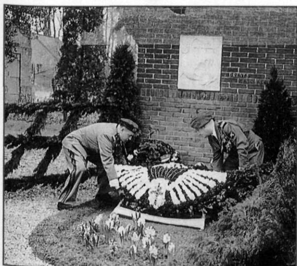
Herdenking operatie Amherst

De wijze waarop Calvert na 28 maart de operatie Amherst van de grond kreeg, verdient alle aandacht en bewondering. Op zeer voortvarende wijze bouwde hij een organisatie op waarin de verschillende