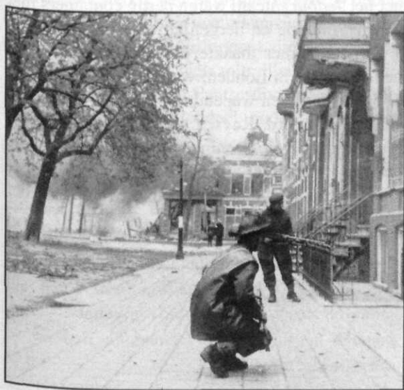
Gevechten in Groningen

het geheel niet van de grond te komen. De luchtmachtcommandanten bleven echter de bevoegdheid behouden om, in geval van slechte weersomstandigheden, de operatie af te gelasten.