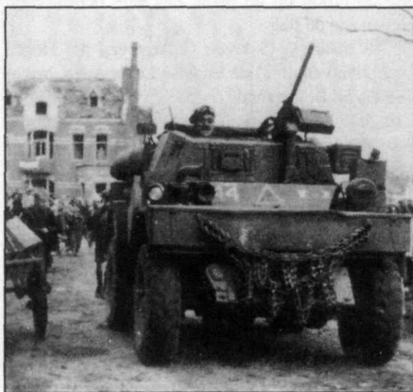
Canadezen bevrijden Coevorden

De Duitse sterkte in Noordoost-Nederland werd door de geallieerden op één divisie met ondersteuning van lokale troepen geschat. Versterking van de vijand op korte termijn werd niet verwacht. Daar stond tegenover dat de Duitsers bij de verdediging een goed gebruik van de talrijke waterhindernissen konden maken. Toen Calvert eenmaal het groene licht voor zijn operatie had gekregen moest er veel worden geregeld. Bij de operatie Amherst waren direct betrokken het Tweede Canadese Legerkorps, de 38 Group van de Royal Air Force (RAF), die voor het transport van de SAS-eenheden van Engeland naar het operatiegebied zou zorgen, de 84 Group RAF , die de tactische luchtsteun van de 21ste Engelse Legergroep verzorgde, de SFHQ en last but not least de beide Franse SAS-bataljons, die de operatie zouden uitvoeren. De opzet was dat de luchtlandingen van de beide Franse bataljons binnen de driehoek Groningen-Zwolle-Coevorden zouden worden uitgevoerd. Nadat de Fransen waren geland, zouden er per parachute achttien jeeeps, die met mitrailleurs waren bewapend, worden afgeworpen. Deze hadden tot