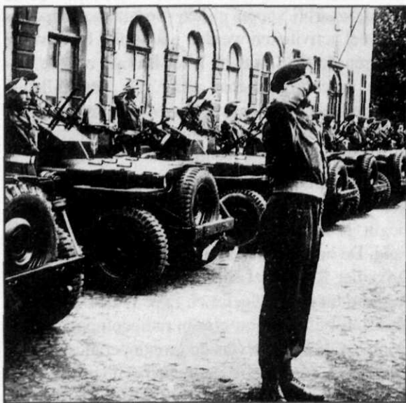
Belgisch SAS-bataljon bij Brussel