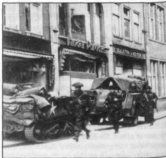
Canadezen trekken Groningen binnen