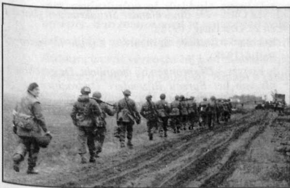
Poolse opmars in Noord Nederland

Op 3 april kreeg Blondeel, die zich met zijn bataljon ten zuiden van Brussel bevond, opdracht om de operatie Larkwood uit te voeren. Deze operatie hield in dat het SAS-bataljon als verkennings-eenheid voor de Vierde Canadese Pantserdivisie zou optreden. Blondeel vertrok met zijn bataljon onmiddellijk naar Coevorden, waar de Duitse linies zouden worden geïnfiltreerd. Op 5 april had het bataljon een sterkte van 14 officieren en 254 onder-officieren, korporaals en manschappen. Het beschikte over vijftig gepantserde jeeps die met Vickers „K” en Browning .5 inch mitrailleurs waren uitgerust. Toen de Poolse Pantserdivisie de Canadezen afloste, kwam Blondeel onder operationeel