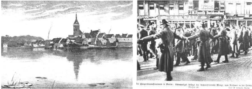
Mölln rond 1900, ernaast: Hamburg, 1923