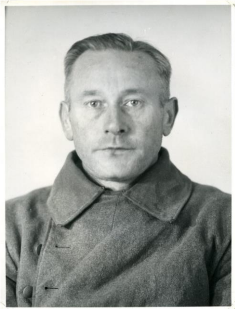
Willy Bühe, 'Judensachbearbeiter' bij de SD Aussenstelle in Arnhem. (Foto: Gelders Archief). De foto is genomen na zijn arrestatie in 1945.