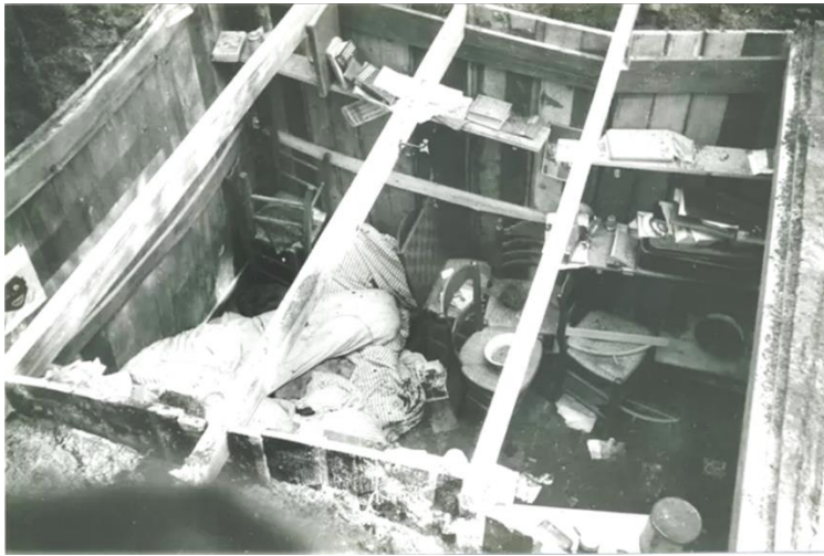
Het gat in het Ansinkbos na opening ervan.

was maar circa 4 bij 4 meter groot, plus nog een soort van halletje ervoor. Wanden en plafond waren van hout; de schuilplaats was afgedekt met zand, dennennaalden en planten zoals rondom groeiden. Kort voor de actie waren nog enkele onderduikers ontsnapt. 42