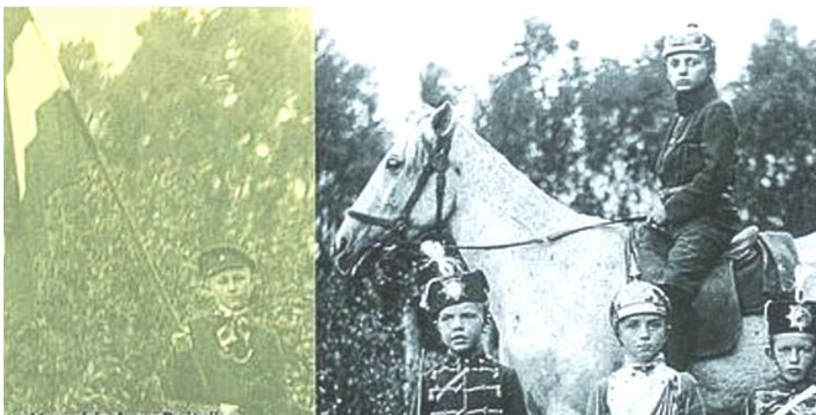
Jongeren in Mölln kort na de eerste wereldoorlog.