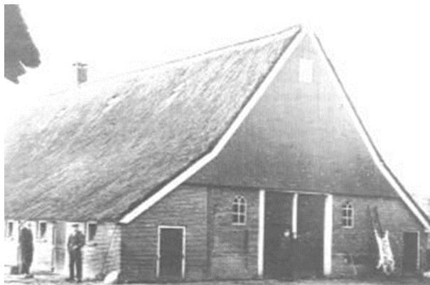
Boerderij van Kottelenberg, gemeente Neede