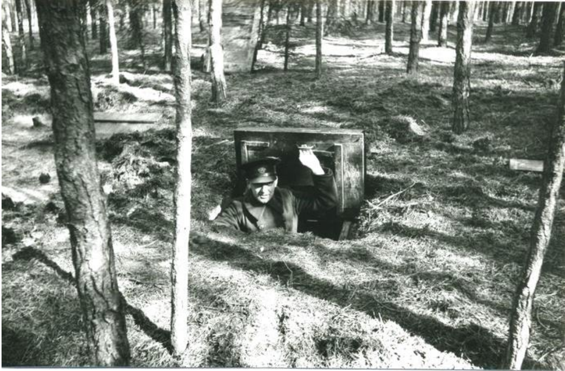
De ondergrondse schuilplaats ten noorden van Eibergen kort na de ontruiming ervan.

In het vooronderzoek tegen Willy BÜhe zijn de arrestaties in Eibergen en Neede en iets later die in Brummen zwaarwegend, omdat hij hierbij persoonlijk aanwezig was en, het staat er niet met zoveel woorden maar we mogen het wel veronderstellen, hierbij ook leidend was.