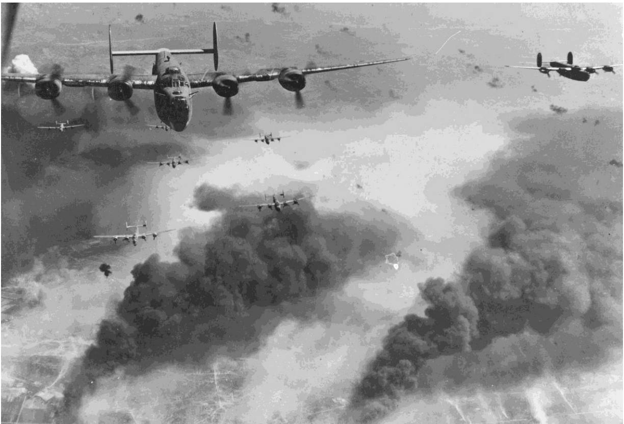
B24 Liberators met de karakteristieke dubbele staartvleugels, boven hun doel in Duitsland

In feite waren beide toestellen vliegende forten, want ze hadden een heel arsenaal aan zware mitrailleurs aan boord. Op de neus, in de staart, boven de cockpit, aan weerszijden van de romp en in een bolvormige koepel onder het toestel. Allemaal om aanvallen van vijandelijke jagers af te slaan.