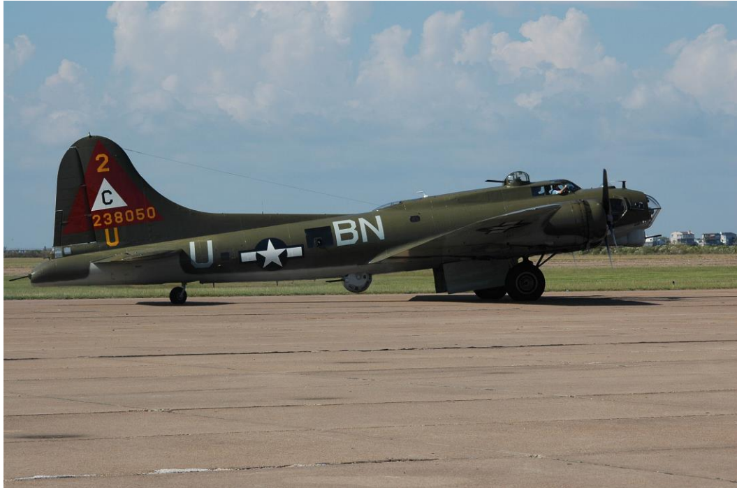
Een goed bewaard gebleven en onderhouden B17 anno nu

Die bewapening werd steeds verder ontwikkeld totdat de definitieve versie 13 zware Browning .50 mitrailleurs aan boord had. De bemanning bestond aanvankelijk uit negen man: de piloot, de copiloot, de bommenrichter/frontschutter, de boordwerktuigkundige/rugschutter, de navigator/radioman, de stuurboord- en de bakboordschutter, de staartschutter en de schutter in de zogeheten 'ball turret' onder de romp.