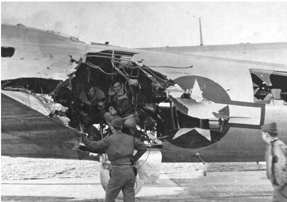
Zelfs zwaar beschadigd keerde ze toch terug naar hun basis

Op de terugweg naar de bases in Engeland kregen de escorterende jagers vaak vrij spel, en beschoten ze onderweg doelen als vliegvelden, spooremlacements en goederentreinen.