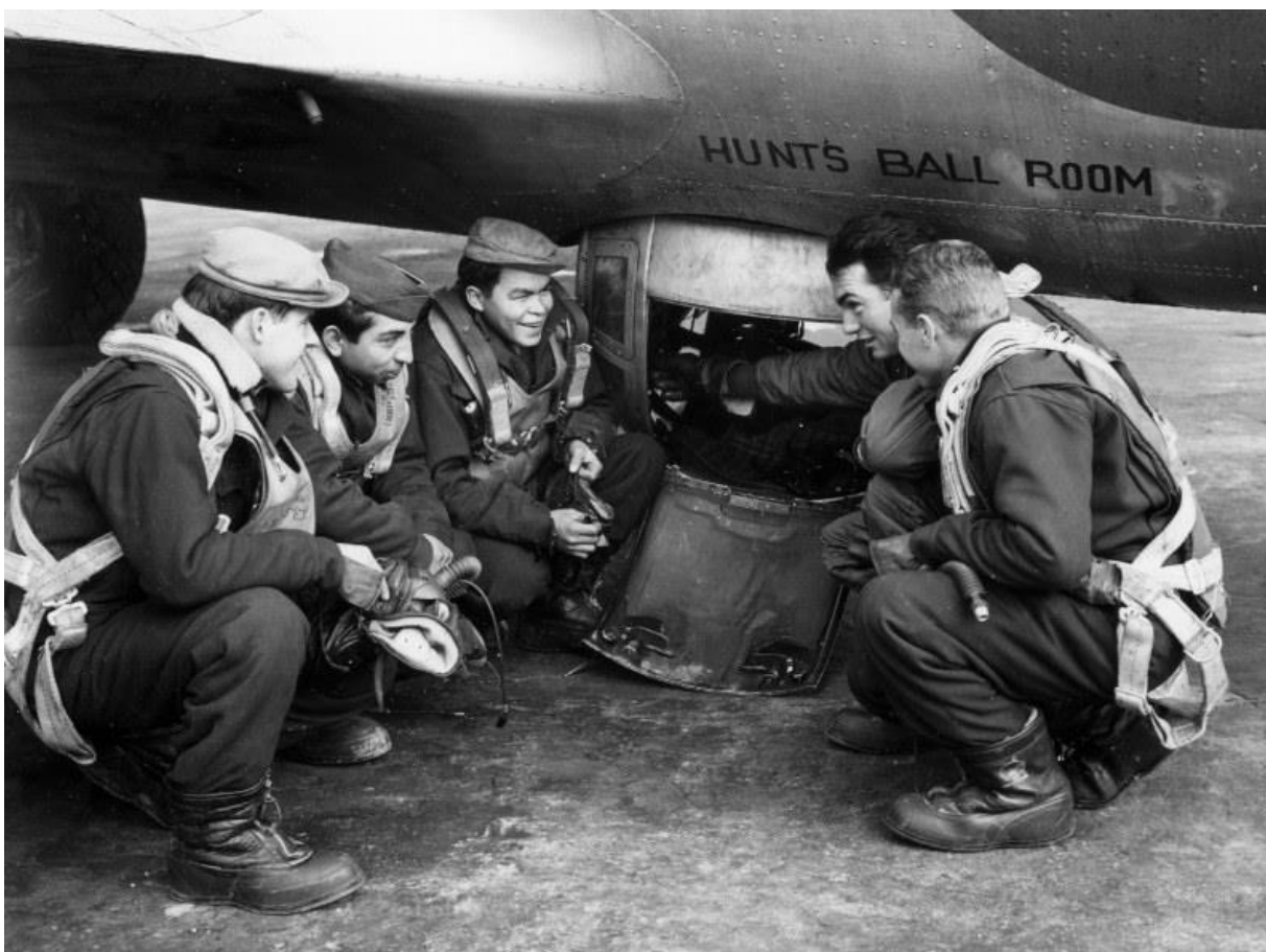
De benauwde werkplek van de buikschutter

De minst populaire positie in de B17 was die van de ball gunner , onder de buik van het toestel. Een benauwde plek die door een nauw luik toegankelijk was en waar de schutter op een rubber slag werd aangesloten voor de onvermijdelijke gevallen van hoge nood. Een plek waar je niet wilde zitten in het geval van een buiklanding. Bovendien ontwikkelden de Duitsers al snel de tactiek om de zwaarbewapende toestellen van onderaf aan te vallen. De andere aanvalsrichting was de frontale met als doel de strakke formatie, waarin de bommenwerpers vlogen, open te breken.