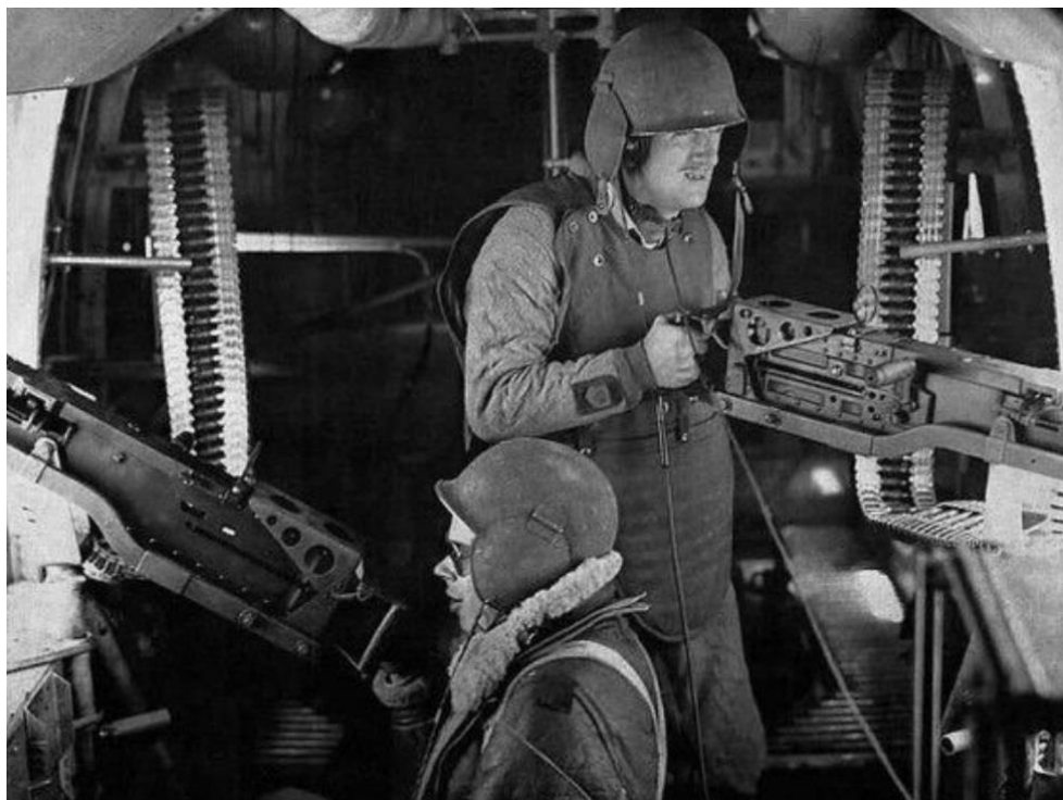
De twee schutters, halverwege de romp van de B17

Die bewapening werd steeds verder ontwikkeld totdat de definitieve versie 13 zware Browning .50 mitrailleurs aan boord had. De bemanning bestond aanvankelijk uit negen man: de piloot, de copiloot, de bommenrichter/frontschutter, de boordwerktuigkundige/rugschutter, de navigator/radioman, de stuurboord- en de bakboordschutter, de staartschutter en de schutter in de zogeheten 'ball turret' onder de romp.