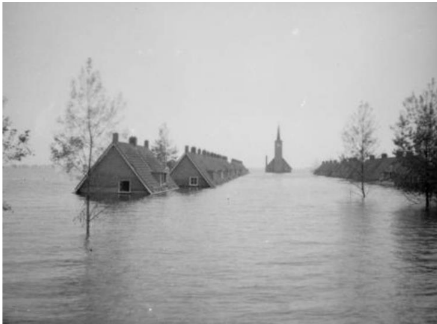
Gezicht op de Gereformeerde kerk in Wieringerwerf kijkend langs de Meeuwstraat

de Geallieerde vrees zo gek niet was. En vechten in zo'n dichtbewoond gebied was ook geen aantrekkelijke optie.