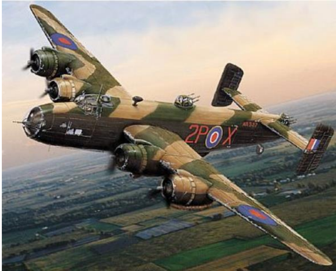
De Halifax BB-223 bommenwerper

Voorst -Een postuum eerbetoon voor de zeven bemanningsleden van de Halifax BB-223 die in 1943 crashte in een akker bij de Klarenbeekseweg in Voorst. Zaterdag 2 maart 2019 werd er een monument onthuld om de zeven omgekomen bemanningsleden te herdenken.