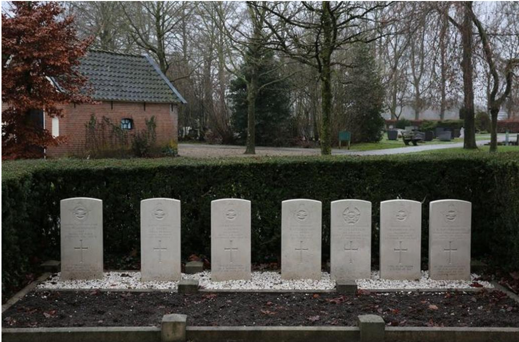
De naast elkaar op de Voorster begraafplaats begraven bemanning

'De Duitsers stonden met luchtafweer voor onze boerderij, maar het was een nachtjager die het vliegtuig neerschoot. Ik bezocht soms de graven van die jongens.