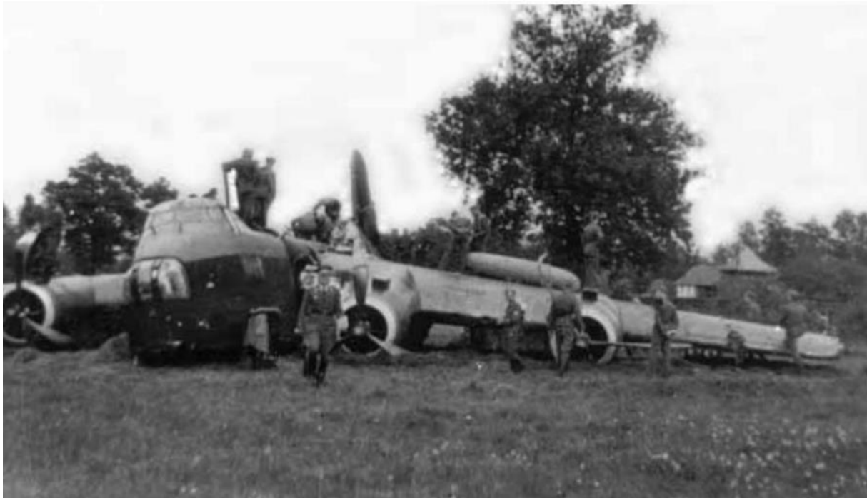
De Stirling N6045 LS-U zoals hij werd aangetroffen door de Duitsers

Hengelo komt de Stirling neer, de bemanning probeert ieder op eigen houtje in veiligheid te komen.