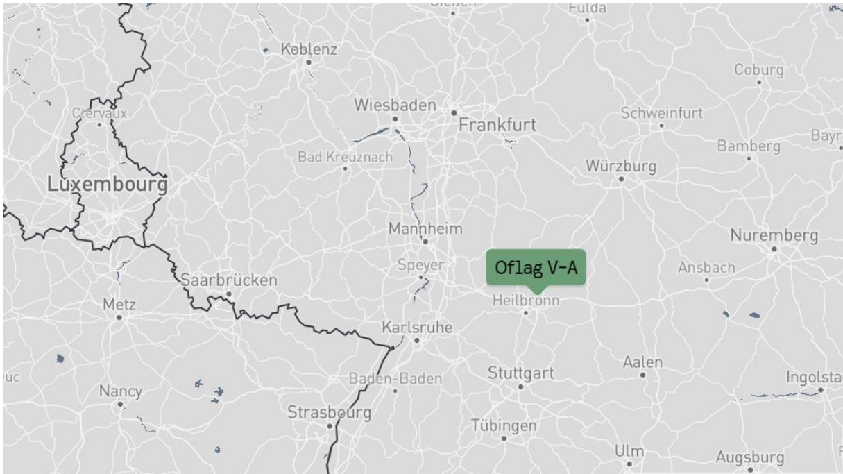
Krijgsgevangenkamp Oflag V-A Het krijgsgevangenenkamp voor officieren te Weinsberg.

(Dit verhaal is geschreven naar aanleiding van de dagboeken van mijn vader.)