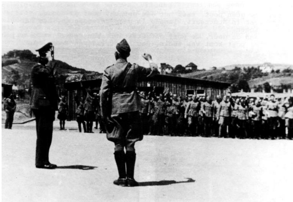
De Nederlandse officieren staan aangetreden in het kamp 'Weinsberg' 1940

Op vrijdag 5 juni zagen we vanaf het kampplein overal vlaggen hangen, ook van de kerk. Waarvoor? Allerlei gissingen deden de ronde tot iemand definitief weet te vertellen: " Duinkerken genomen ". Daarom acht dagen vlaggen en drie dagen klokluiden.