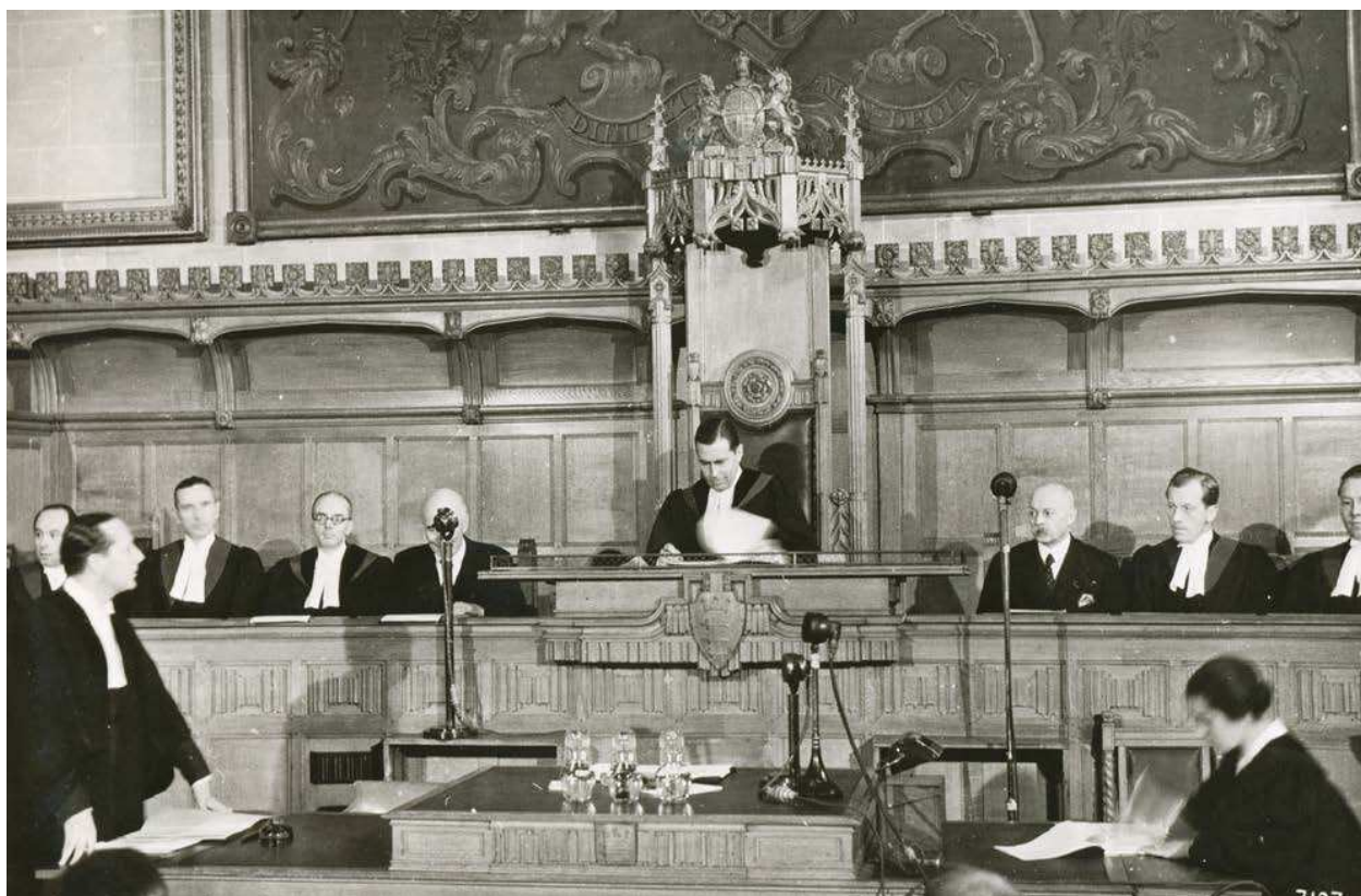
17. Eerste zitting van de Nederlandse rechtbank te Londen in de Middlesex Guildhall.

betalingen en verlop bevatten, zijn bewaard gebleven. Ook kunnen de staten van zeelieden die in 1954 recht hadden op de Vaarplichtbeloning nog worden geraadpleegd. Van de Zeemanspot bleven de lijsten met namen van families die door de Zeemanspot geholpen werden bewaard. Welke ondersteuning zij van de Zeemanspot kregen staat hierop vermeld. <<