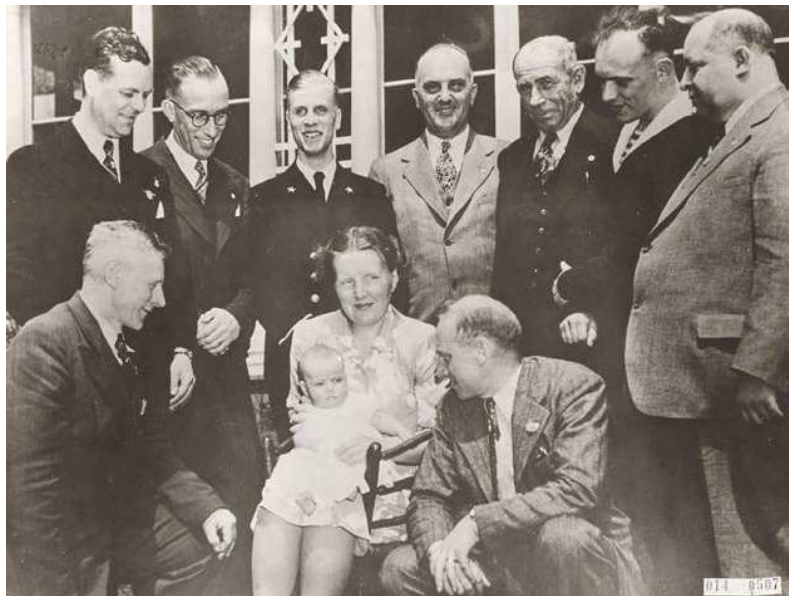
12. Koopvaardijmannen op bezoek bij prinses Juliana en prinses Margriet in 1943. Na haar geboorte werd prinses Margriet petekind van de Nederlandse koopvaardij.

Op de persoonskaart van een opvarende staat aangetekend of hij een officiersopleiding of een cursus aan de DEMS-school heeft gevolgd. Als iemand de opleiding tot kanonnier heeft gevolgd staat dit veelal vermeld met 'oerlikon cursus'. Het is onbekend of examenregisters van de DEMS-school in Liverpool nog bestaan. Naast de aantekening op de persoonskaart is op bemanningslijsten van schepen na te gegaan of iemand op het schip diende als kanonnier. Wanneer iemand een officiersopleiding heeft gevolgd staat dit op de persoonskaart aangetekend met 'opleiding' of 'studie'. De examenregis-