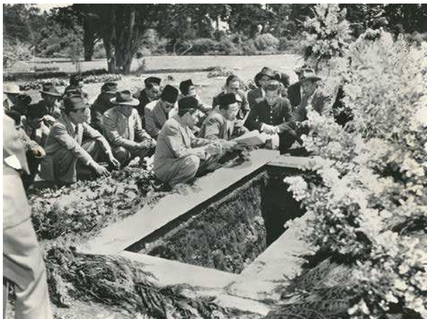
8. Begrafenis van een Indonesische opvarende van de Nederlandse koopvaardij te San Francisco.