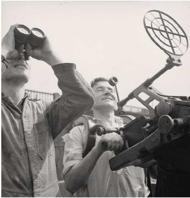
4. De kok van deze Nederlandse kustvaarder bemant het afweergeschut, Groot-Brittannië 1943.

was het s.s. Slamat , dat op 27 april 1941 onder leiding van kapitein Tj. Luidinga met ongeveer 500 Britse militairen en ruim 200 bemanningsleden uit Nauplia vertrok. De Slamat werd door de Luftwaffe gebombardeerd en zonk. Van de opvarenden overleefden maar een kleine twintig de ramp. 16 De BMWT zette ook Nederlandse koopvaardij schepen in voor de invasie van Noord-Afrika, Italië en Zuid-Frankrijk.