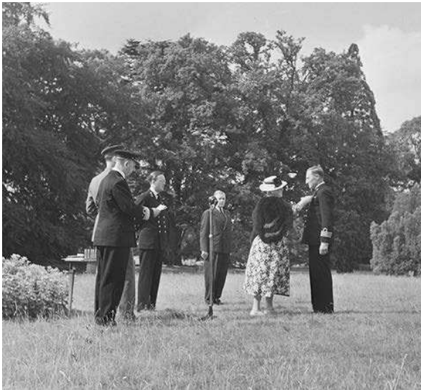
14. Uitreiking van een onderscheiding aan een opvarende van de Nederlandse koopvaardij door koningin Wilhelmina.

Lingfield ondergebracht. 33 Ook in andere landen, zoals Canada, de Verenigde Staten en Zuid-Afrika, werden Nederlandse zeelieden die weigerden te varen berecht en gevangen gezet. Volgens schattingen weigerden tussen de 6 en 8% van de Nederlandse zeelieden tijdens de oorlog te varen. 34