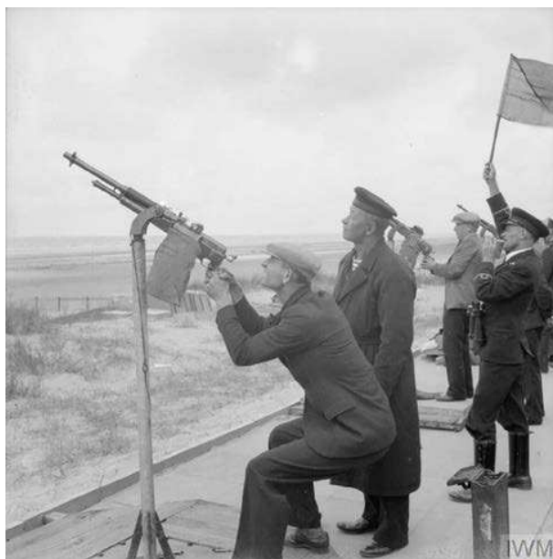
15. Een Nederlandse instructeur leert een Nederlandse koopvaardij-opvarende schieten met een Hotchkiss machinegeweer.

gerecht voorwaardelijk waren gestraft. Er werden tijdens de oorlog 93 zeelieden onder toezicht gesteld die door het Centraal Toezicht werden geholpen. Naast hulp aan deze groep zeelieden bezochten werknemers van het Centraal Toezicht ook de tot gevangenisstraf veroordeelden in de gevangenis. 37 Als een zeeman in aanraking kwam met één van de Nederlandse rechtbanken in Londen, door een lokale rechtbank was berecht of door de Centrale Inlichtingen Dienst of de Politie Buitendienst was ondervraagd, werd hiervan een aantekening gemaakt op zijn persoonskaart. Persoonsdossiers van het Nederlandse kantongerecht, de Nederlandse rechtbank en dossiers van de Buitengewone Raad voor de Scheepvaart zijn bewaard gebleven, net als de inlichtingenrapporten van de Centrale Inlichtingen Dienst en de Politie-Buitendienst.