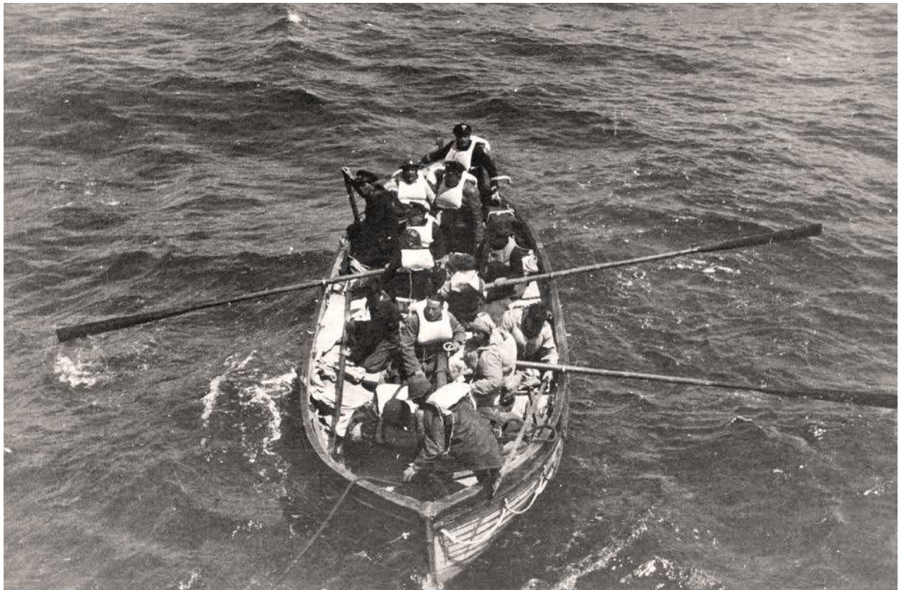
7. Schipbreukelingen van het Nederlandse vrachtschip s.s. Polyphemus, dat op 26 mei 1942 werd getorpedeerd, worden opgepikt door het Portugese vrachtschip s.s. Maria Amelia.