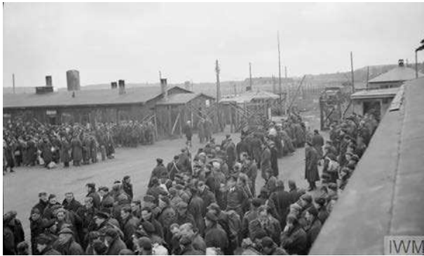
13. De bevrijding van geallieerd Marine- en koopvaardijpersoneel uit kamp Marlag und Milag Nord, 29 april 1945.