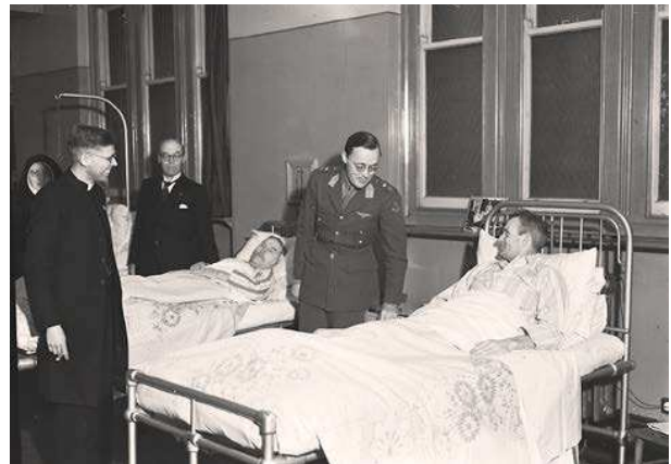
9. Bezoek van prins Bernhard in 1944 aan het St. Joseph Hospital in Preston, waar o.a. Nederlandse koopvaardijopvarenden werden behandeld.