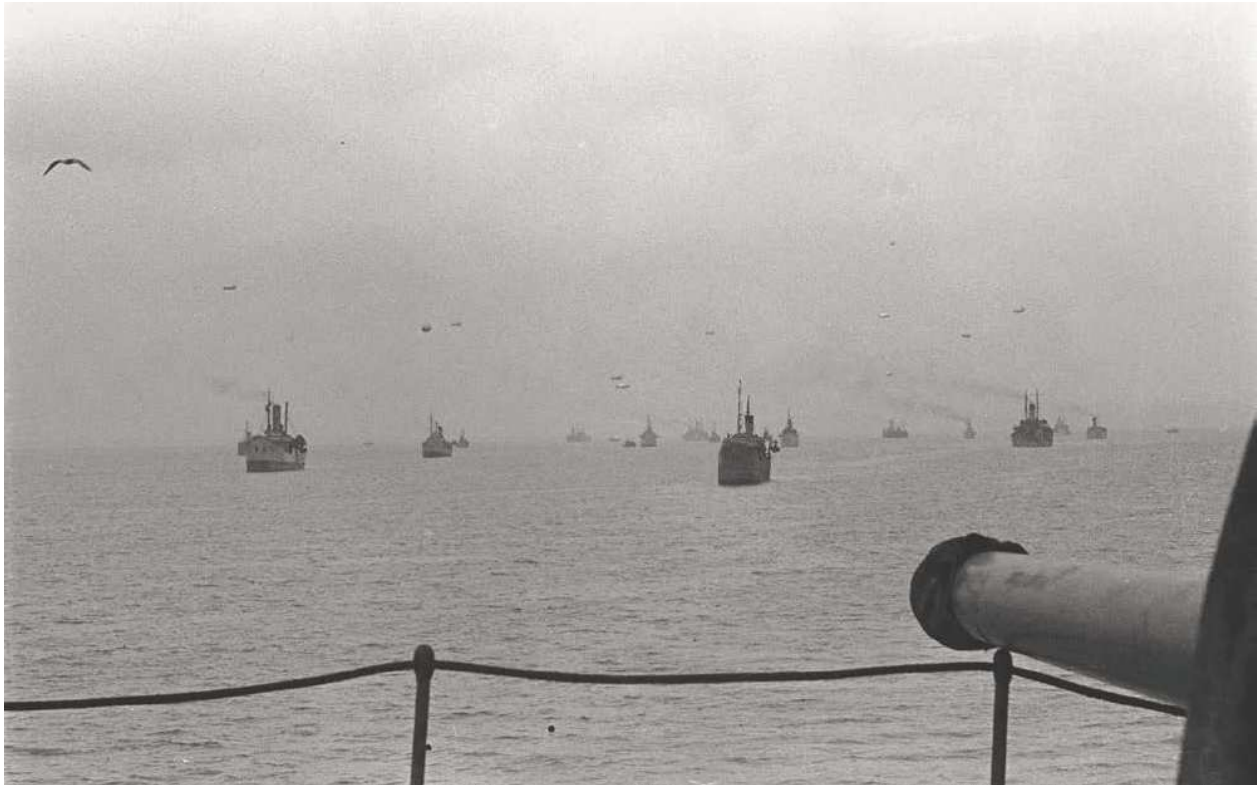
1. Zicht op een konvooi vanaf een Nederlandse tanker.

Vaak wordt vergeten dat de opvarenden van de Nederlandse koopvaardij tijdens de Tweede Wereldoorlog een belangrijke bijdrage leverden aan de geallieerde oorlogsvoering. Na de Meidagen van 1940 werd de Nederlandse handelsvloot –bestaande uit honderden koopvaardij schepen, die zich voor een belangrijk deel buitengaats bevonden– gevorderd ten behoeve van de geallieerde oorlogsinspanning. De duizenden bemanningsleden hebben tijdens de oorlog troepen, wapens, munitie en levensmiddelen over de wereldzeeën vervoerd. Zij deden dit onder zeer gevaarlijke omstandigheden. Jarenlang konden zij niet terugkeren naar hun families in Nederland. Dit artikel beschrijft de geschiedenis van de Nederlandse koopvaardij tijdens de Tweede Wereldoorlog en legt uit hoe men genealogisch onderzoek kan uitvoeren naar haar opvarenden.