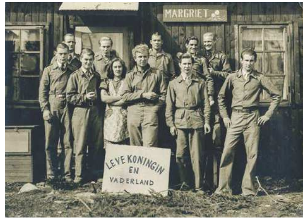
11. Engelandvaarders in het houthakkerskamp Lundby Fogdö in Zweden.

Op 16 maart 1944 kwam het tot de instelling van het Oorlogs-Herinneringskruis (OHK). Deze herinneringsmedaille was bedoeld als blijk van waardering van de regering aan o.a. opvarenden van de koopvaardij die zich tijdens de oorlog hadden ingezet. Alle opvarenden van de geallieerde Nederlandse