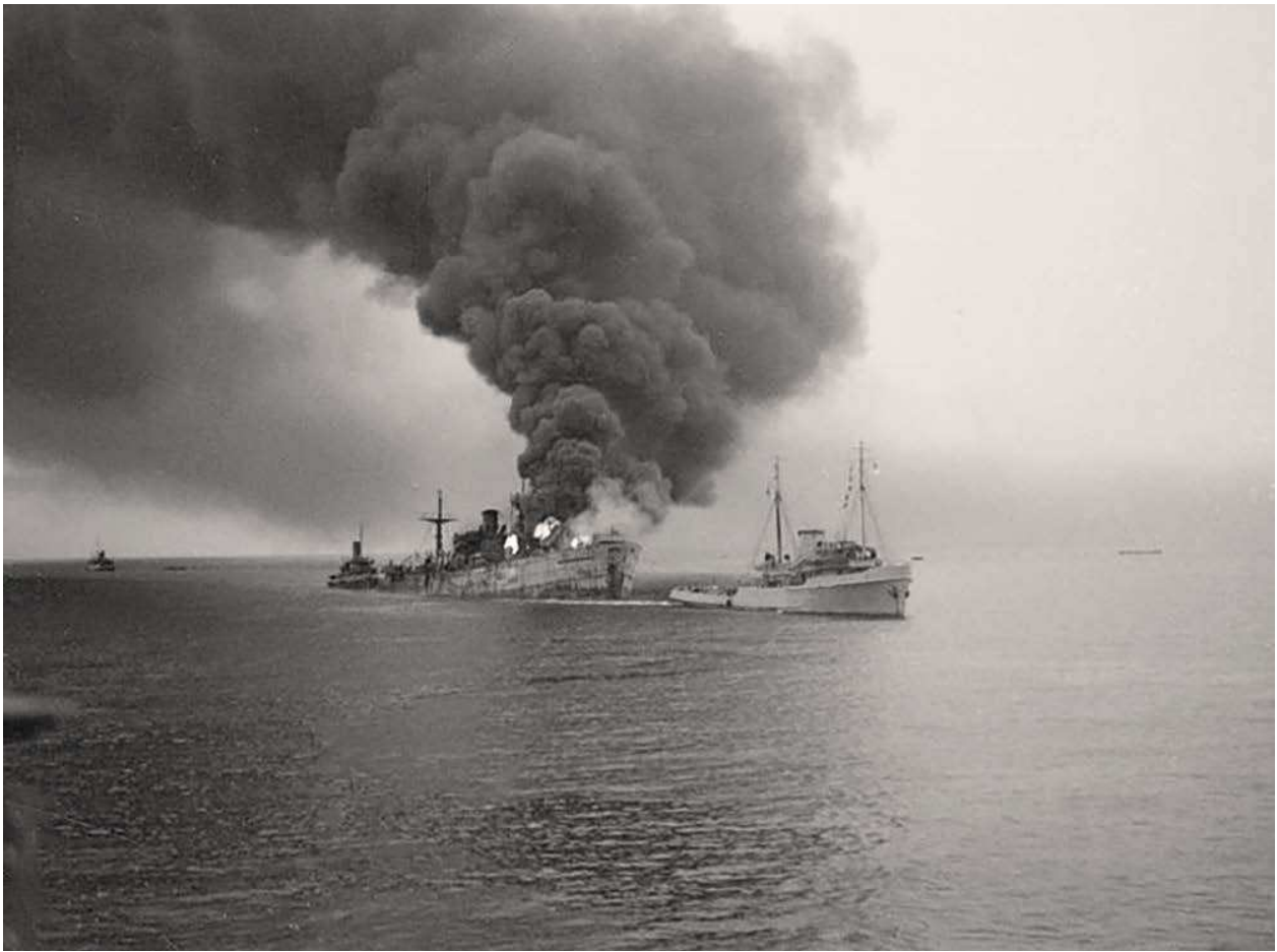
3. De sleepboot Zwarte Zee met op sleeptouw de s.s. Flora MacDonald die op 19 mei 1943 door een U-Boot in de Atlantische Oceaan was getorpedeerd. Imperial War Museum (AX 44A).

troepen vanuit Duinkerken. Ongeveer veertig Nederlandse kustvaartschepen evacueerden plus minus 22.000 militairen. 12 Tijdens de Meidagen weken 42 Nederlandse vissersschepen uit naar Groot-Brittannië. Daarvan werden 26 schepen, inclusief bemanning, door de Koninklijke Marine gevorderd om dienst te doen als hulpmijnenvegers in Britse wateren. De bemanning werd gemilitariseerd en het schip kwam onder bevel van een marineofficier te staan. De overige schepen bleven dienst doen als vissersschepen en hielpen daarmee met de bevoorrading van Groot-Brittannië. 13