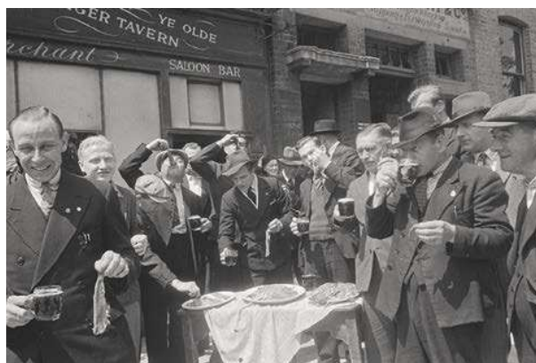
18. Haring etende Nederlandse koopvaardijmannen op uitje in Londen.