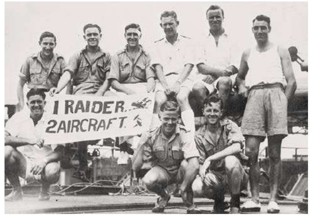
2. De bemanning van de olietanker Ondina van de Petroleum Maatschappij La Corona . Op 11 november 1942 werd het schip in de Indische Oceaan geëscorteerd door HMIS Bengal toen het werd aangevallen door twee Japanse kruisers, de Hokoku Maru en de Aikoku Maru . De Hokoku Maru werd door het kanonvuur van de Ondina tot zinken gebracht.

Eind mei 1940 beschikte de naar Londen uitgeweken Nederlandse regering over 557 schepen. 6 De Shipping verhuurde op basis van een timecharter een groot deel van de nationale scheepsruimte aan het British Ministry of Shipping en haar opvolger, het British Ministry of War Transport (BMWT). Hierbij bepaalde het BMWT de lading, de bestemming en vaarroutes van de schepen en was het verantwoordelijk voor de kosten van het laden en lossen, havengelden, brandstof en eventuele verliezen van schepen door oorlogsgeweld. De verschillende rederijen die behoorden tot de Koninklijke Shell, zoals de Petroleum Maatschappij La Corona, de Nederlandsch-Indische Tank Stoombootmaatschappij en de Curaçaosche Scheepvaart & Handel Maatschappij, werden door die maatschappijen zelf aangestuurd en vielen niet onder de verantwoordelijkheid van de Shipping . Schepen van de Shell werden wel rechtstreeks ter beschikking gesteld aan de BMWT. 7 In Nederlands-Indië waren na de Meidagen rond de 250 schepen ter beschikking gekomen van de Nederlands-Indische regering. Deze bleven in de vrije vaart en werden niet ingezet voor oorlogsdoeleinden. De regering besliste in overleg met het Nederlands-Indisch Reeders Comité over de inzet van de schepen. Na de Japanse invasie in januari 1942 en de val van Nederlands-Indië twee maanden later kwamen de 120 niet verloren gegane schepen ter beschikking van de geallieerden en werden verhuurd aan de BMWT. 8