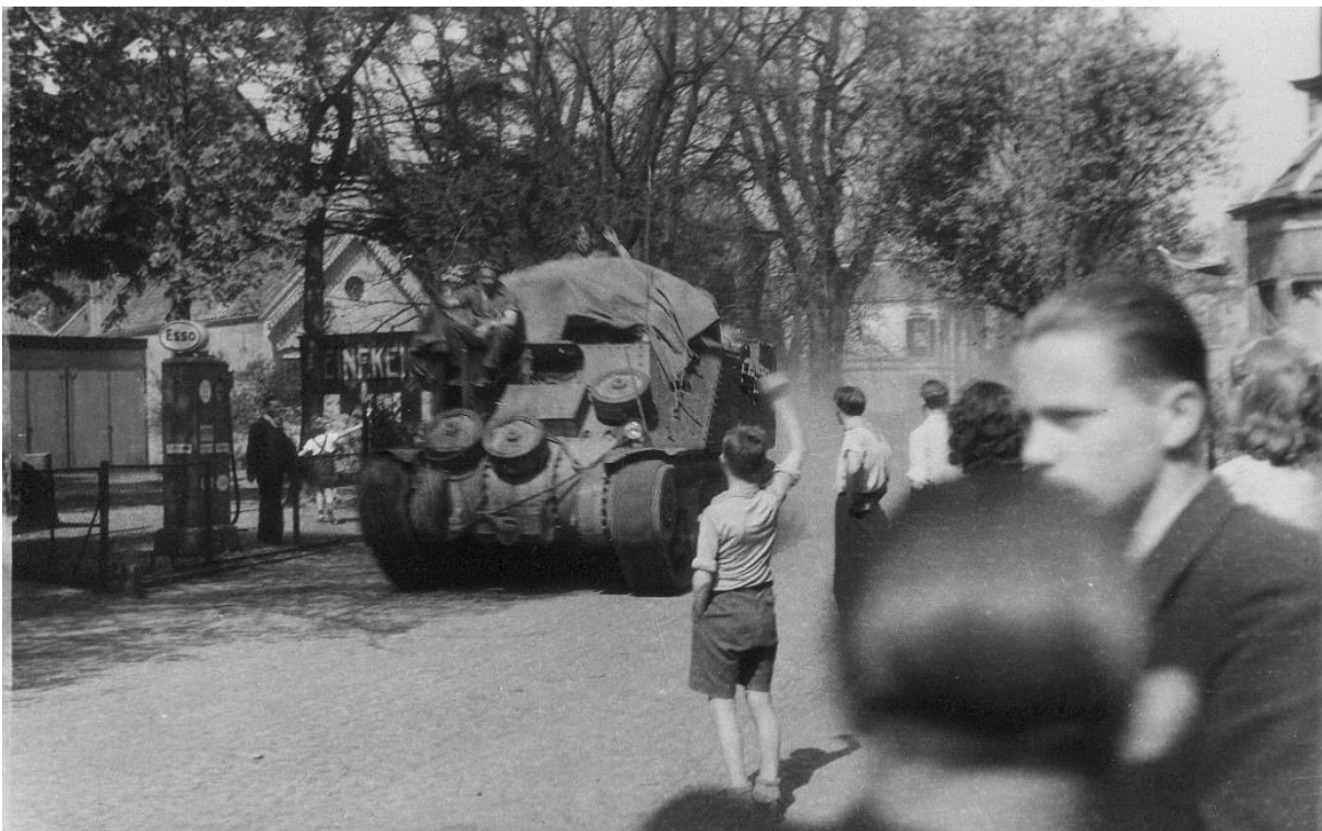
Tanks rijden Dieren en Spankeren in