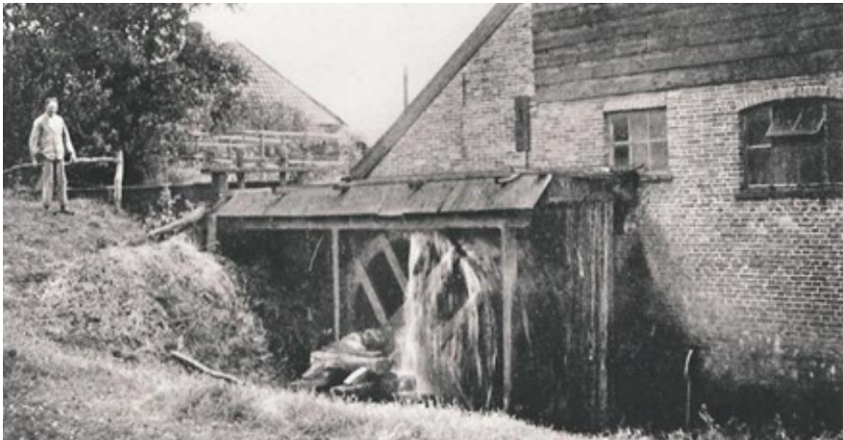
In Laag Soeren werden veel papierfabricage locaties omgedoopt tot wasserijen

De buurvrouw had een potje, daar werd om gelachen, maar later goed gebruikt, in de hoek van de zolder met een deken ervoor. Praten hoorde je niet, iedereen fluisterde, het was wel angstig [..]. De mannen hielden om de beurt de wacht. De volgende dag mochten wij de kachels van de wasserij gebruiken.