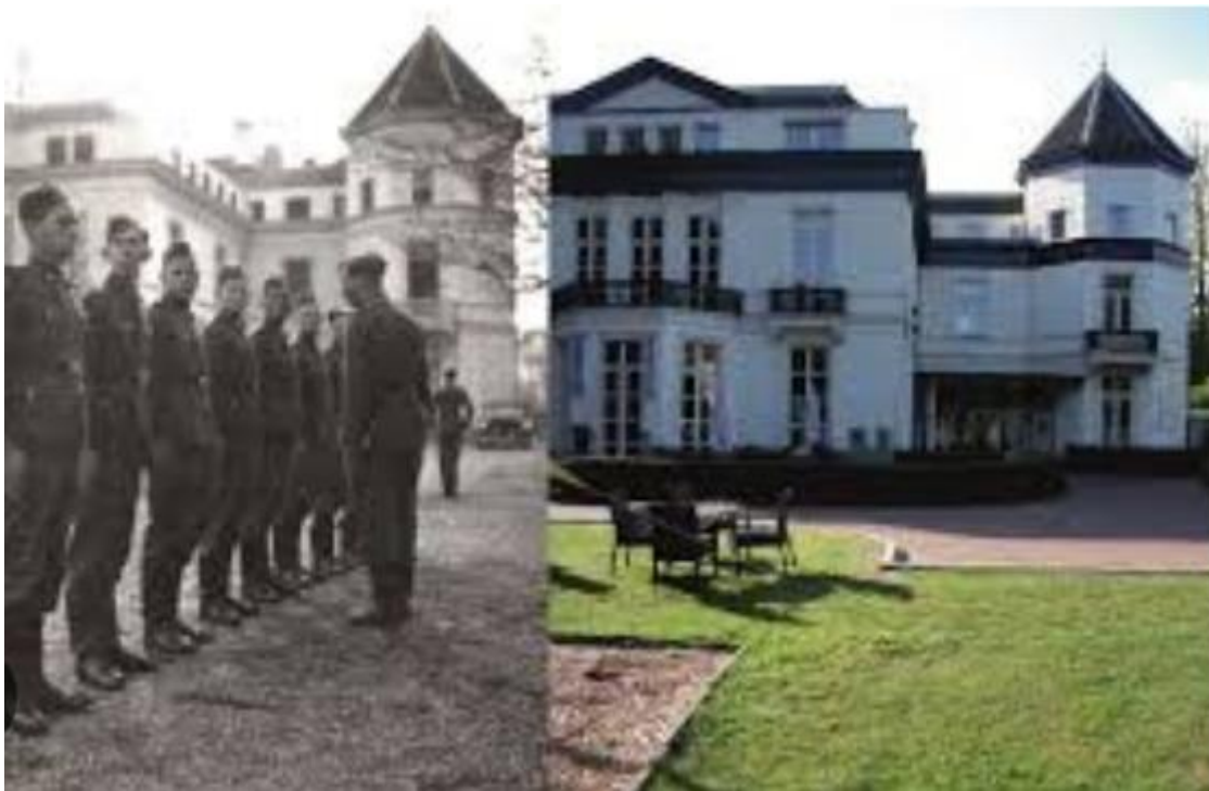
SS opleidingskamp Avegoor

Hij was er ’s avonds kapot van. Hij had nog nooit zoveel ellende gezien [..]. Ik heb een paar keer een handkar gezien met een kist erop. Joden op klompen met een nummer op de rug erbij. Dat was een begrafenis. Heel wat arme joden zijn in Dieren verdwenen.