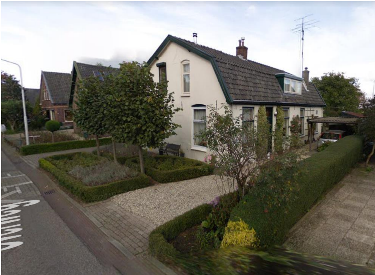
Overweg 10 in Spankeren