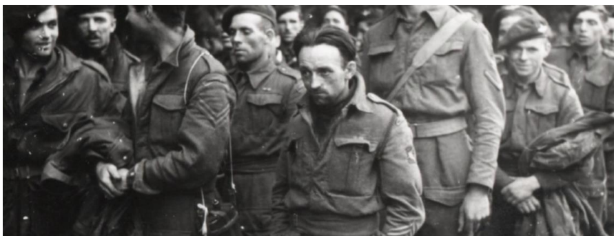
Krijgsgevangen Engelse soldaten

Op een dag zagen we honderden mannen die in de steden waren opgepakt door de Duitsers. Sommigen hadden de pantoffels nog aan [...]. Die moesten allemaal naar Duitsland toe. We hebben de adressen van die mensen gekregen en die mensen laten weten wat er gebeurd was. Op de Zutphensestraatweg achter ons huis hebben zich veel drama's afgespeeld.