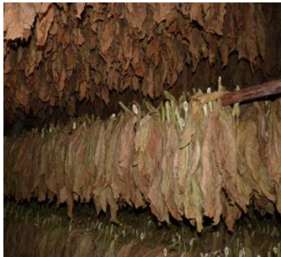
Tabaksbladeren die hangen te drogen

Koffie en thee maakten we zelf van bonen, Cichorei en Buisman en thee van de struiken [...], en vader rookte het in zijn pijp. Hij moest wel naar buiten want het stonk verschrikkelijk. Ook werd er zelf tabak geteeld. Een buurman had de beste tabak., zei hij. De jongens uit Spankeren wisten waar de bladeren te drogen hingen. In het kippenhok.