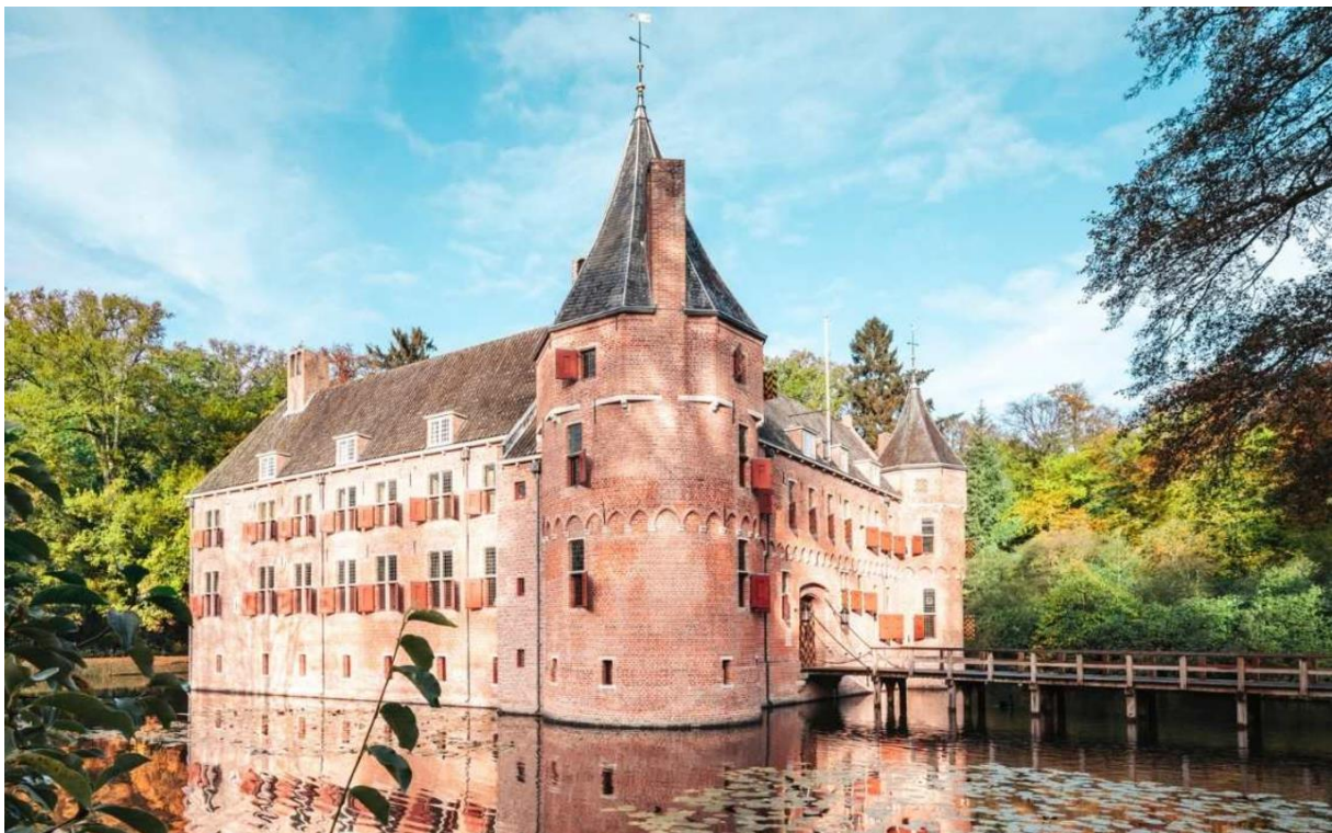
Het Oude Loo

Al die tijd blijft de staf van de koningin in het paleis. In het geniep redden ze meer dan 600 kilo bronzen en koperen voorwerpen, door ze onder de vloer van de eetzaal te verstoppert [..]. “Alle belangrijke objecten, stukken uit voorgaande eeuwen, zijn overgebracht naar de vroegere Grote Eetzaal, waar ze zijn gefotografeerd. Daarna zijn ze in veiligheid gebracht, onder meer iets verderop bij het Oude Loo en het koninklijk jachthuis in Gortel.”