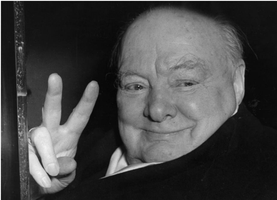
Winston Churchill dwingt Wilhelmina