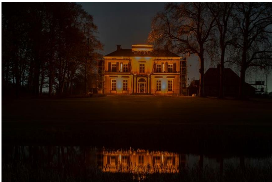
Landgoed Reuversweerd in Brummen. Deze foto werd genomen tijdens 'Orange the World', waarbij gebouwen oranje kleuren om aandacht wordt gevraagd voor geweld tegen vrouwen.

“Na de oorlog haalde de barones alle huisraad op en sloot het huis. Zo heeft het er zeventig jaar bijgelegen, inclusief kogelgaten in de muren.” Het landhuis heeft een nieuwe eigenaar, die restauratieplannen heeft. “Die oorlogsschade vertelt een bijzonder verhaal. De vraag is, laat je de kogelgaten zitten of niet?”