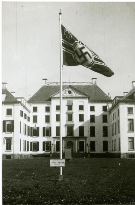
De nazivlag wappert voor paleis Het Loo. De bezetter geeft hiermee een duidelijk signaal af. Het paleis werd al op 12 mei 1940 door de Duitsers ingenomen.

De meeste eigenaren durfden hun landgoed niet te ontvluchten [...]. Zij werden gedwongen zich tot de bezetter te verhouden. Dat leverde buitengewoon spannende situaties op. Er zijn voorbeelden van landgoederen waar zowel Duitsers als onderduikers gelijktijdig onderdak hadden. Zelfs op Het Loo zaten onderduikers [...], terwijl de hakenkruisvlaggen fier wapperden op de binnenplaats.