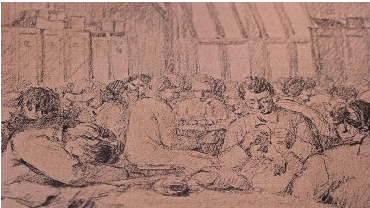
Tekening impressie Ravensbrück - Het Museum Winterswijk, collectie familie Kuipers

Eind oktober gaat het mis. Heleen Kuipers wordt zelf ziek en op 27 of 28 december sterft ze op 51-jarige leeftijd, waarschijnlijk aan tyfus of een longontsteking.