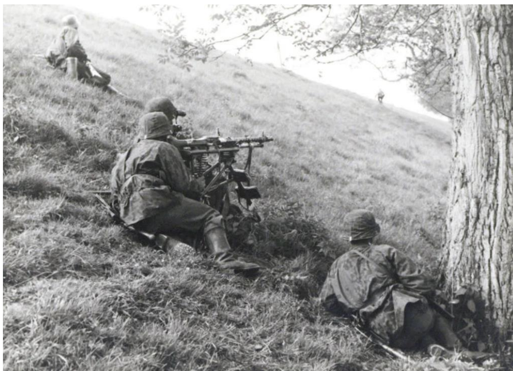
Soldaten van de SS op de Grebbedijk tussen de haven van Wageningen en de Wageningse Afweg.

Berichten over de naziterreur hadden Nederland uiteraard ook voor mei 1940 al bereikt. Veel Nederlanders vestigden hun hoop op de Nederlandse neutraliteitspolitiek. Niet geheel verwonderlijk. Mede dankzij die politiek had het land immers al 135 jaar geen oorlog gekend. Zelfs toen Noorwegen en Denemarken in het voorjaar van 1940 werden overrompeld door de nazi's, bleven velen hun hoop vestigen op de neutraliteitspolitiek. Op 10 mei 1940 werd die hoop door de Duitse inval echter de grond in geboord. Ook voor Nederland was de Tweede Wereldoorlog begonnen.