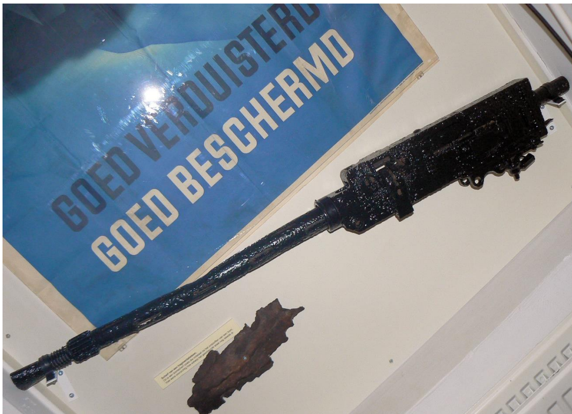
In 2012 is deze boordmitrailleur, de Browning .303 Mark II gevonden. Vrijwel zeker afkomstig van de neergestorte Lancaster

Kort na de crash verschijnt de Vordense politie, gevolgd door twee vrachtwagens met Duitsers van een speciale eenheid, zij sturen de plaatselijke politie meteen weg. De Duitsers komen uit Toldijk en zijn verantwoordelijk voor alle vliegtuigen die hier in de regio worden neergeschoten. Zij zijn voor hun doen snel ter plaatse, omdat zij dachten dat er een Duitse jager is neergeschoten.