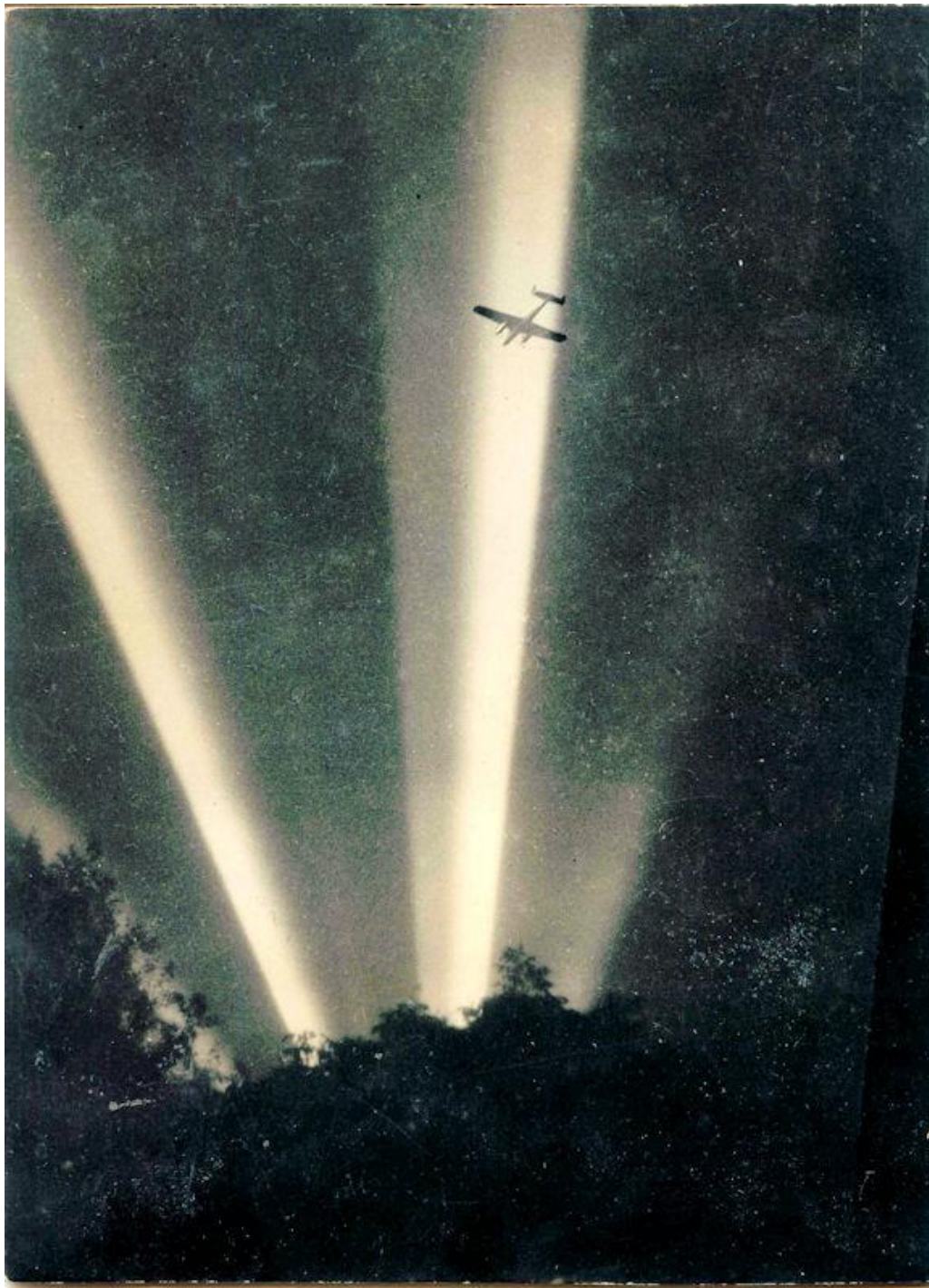
Een bommenwerper 'gevangen' in een lichtstraal van een zoeklicht

Na het verliezen van die verschillende onderdelen, stort de Lancaster met grote snelheid neer tussen de boerderijen van J.L. Klein Brinke en D. Norde. Tot vijf minuten na de crash vallen er nog brokstukken uit de lucht, verspreid over een groot gebied. Omdat de Lancaster op de heenweg is, hangt er nog een bom aan het vliegtuig. En dat is een flinke: een 4000 ponder met meer dan 1000 kilo springstof. Daardoor is er bij de crash een enorme explosie, er blijft dan ook niets van het vliegtuig over.