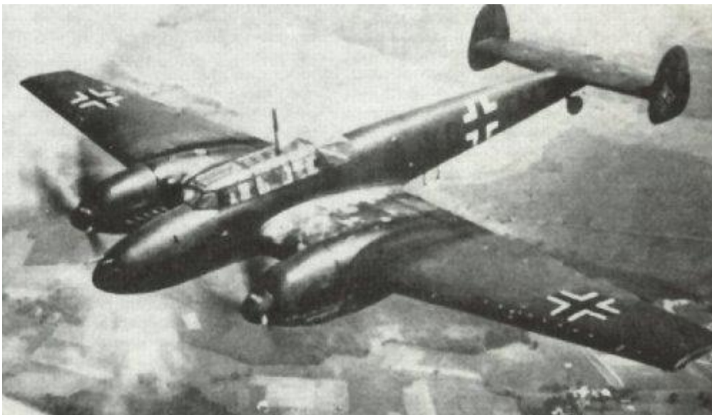
Messerschmitt Me 110

De heenweg verliep zonder noemenswaardige incidenten. Het doel werd vanaf ruim 3 kilometer hoogte (10.000 Feet) gebombardeerd met brandbommen. Op de terugvlucht sloeg echter het noodlot toe! Whitley P-4964 werd gepeild door het pas operationele Duitse radarstation bij Nunspeet. Deze stond in verbinding met de zoeklichtcomplexen te Giesbeek en Vorden. Het toestel werd gevangen in de zoeklichtbundels en even later neergeschoten door een Duitse Messerschmitt Me 110 nachtjager afkomstig van de vliegbasis Deelen .