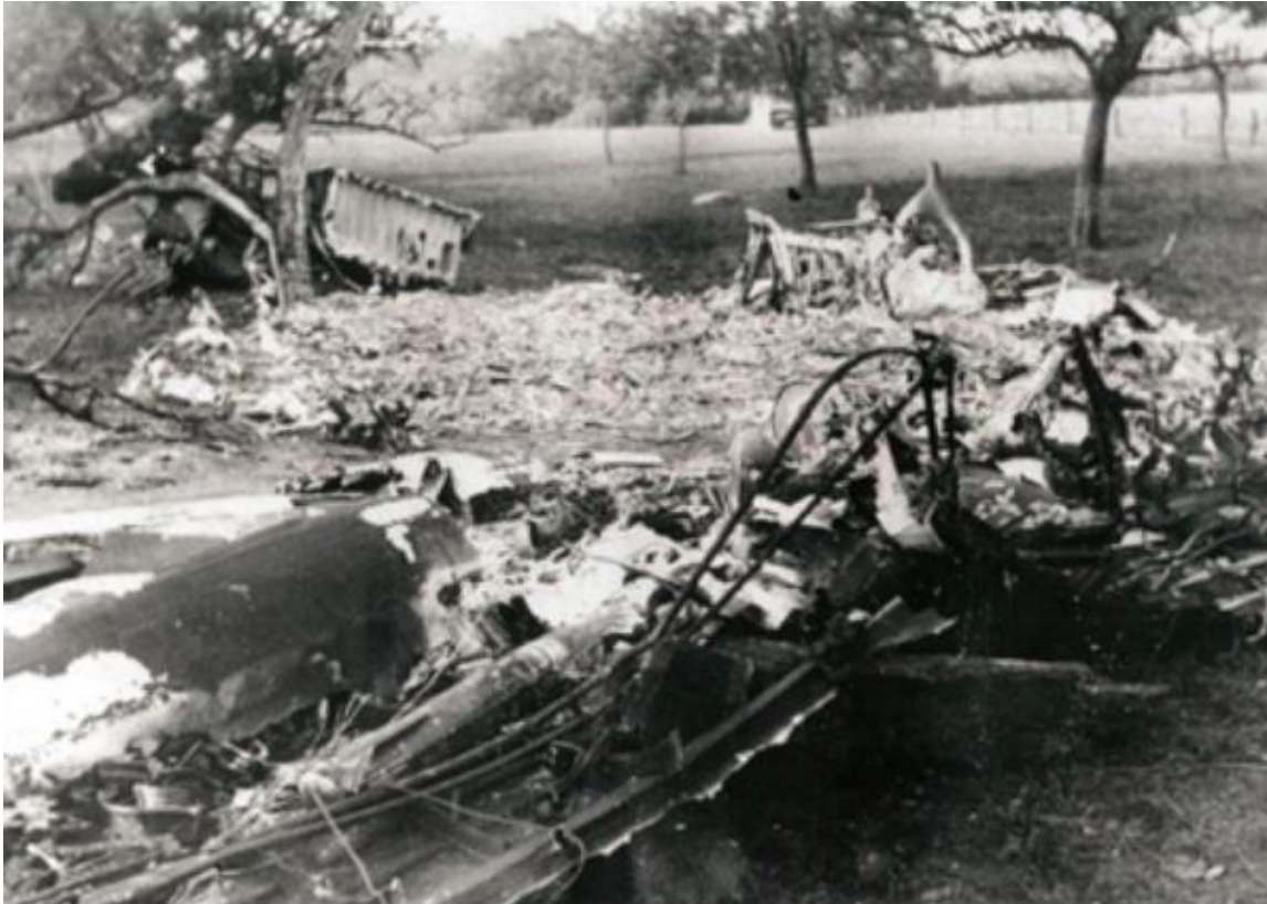
Resten van de rechtervleugel in een perceel bieten