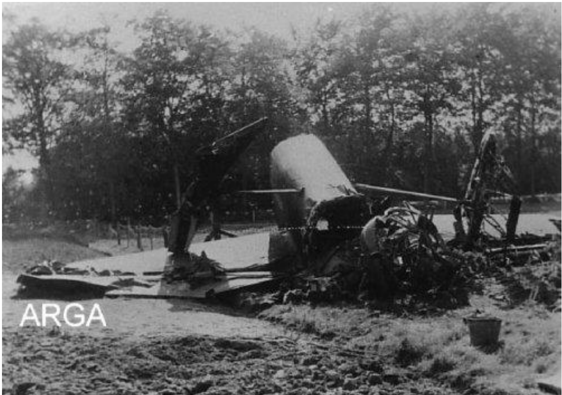
Het staartstuk naast het huis van Schreurs