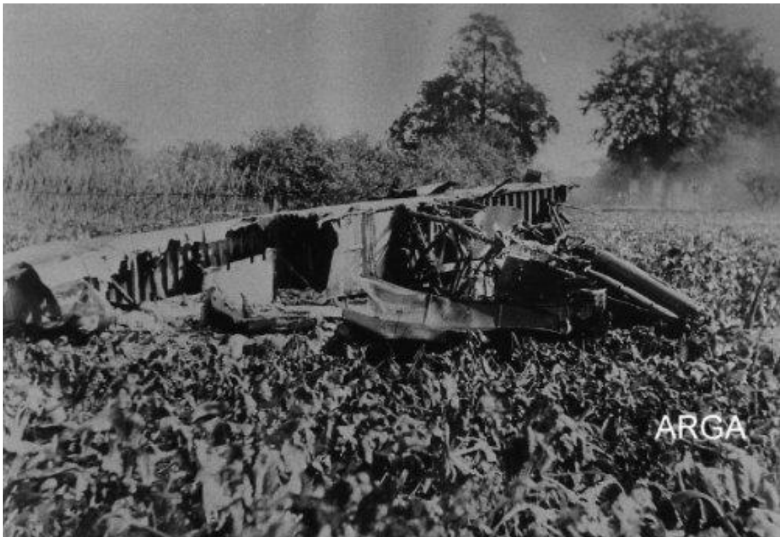
Een vleugel met motor voor boerderij "de Balen"