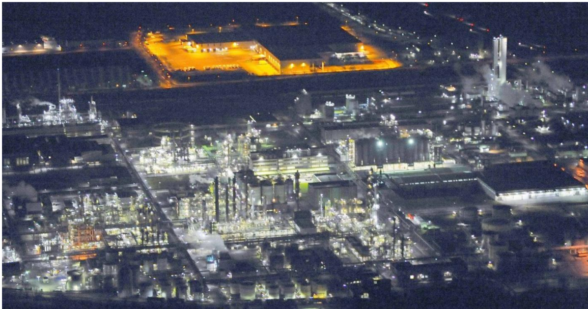
Ruhrchemie in Sterkrade/Holten

In de nacht van 1 op 2 oktober 1940 werd na een luchtgevecht een Britse Whitley bommenwerper neergeschoten bij boerderij “De Balen”, aan de Hessenweg in Hummelo.