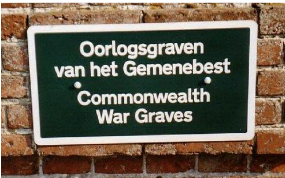
Het groene bordje met opschrift "Oorlogsgraven van het Gemenebest"

Ieder jaar op 4 mei 's avonds leggen we kransen en bloemen op de graven van 5 vliegeniers uit het Britse Gemenebest op de Begraafplaats in Hummelo. Al bijna 70 jaar liggen zij begraven in Hummelo, ver van de plaatsen waar ze vandaan kwamen. Het groene bordje met opschrift "Oorlogsgraven van het Gemenebest" ( Commonwealth War Graves ) op de poort van het kerkhof geeft aan dat zij hier begraven liggen.