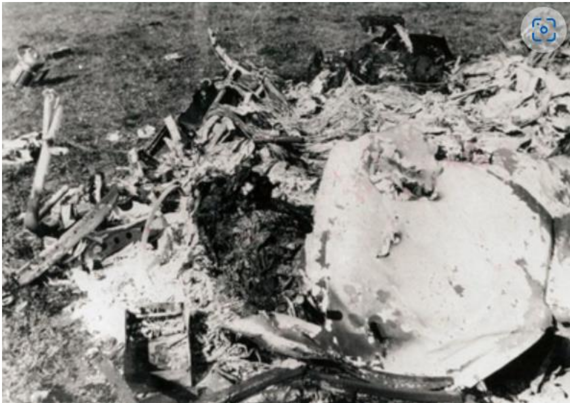
Een gruwelijke opname van het staartstuk met het stoffelijk overschot van een van de zeer jonge bemanningsleden