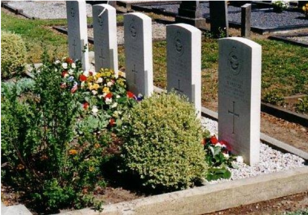
De graven van de bemanning van Whitley P-4964 op het kerkhof in Hummelo

Ieder jaar op 4 mei 's avonds leggen we kransen en bloemen op de graven van 5 vliegeniers uit het Britse Gemenebest op de Begraafplaats in Hummelo. Al bijna 70 jaar liggen zij begraven in Hummelo, ver van de plaatsen waar ze vandaan kwamen. Het groene bordje met opschrift "Oorlogsgraven van het Gemenebest" ( Commonwealth War Graves ) op de poort van het kerkhof geeft aan dat zij hier begraven liggen.