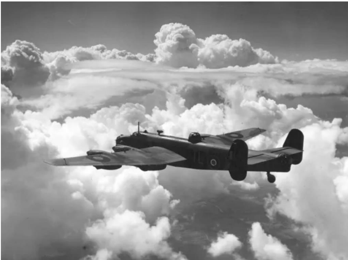
Een Canadese Halifax DK 134