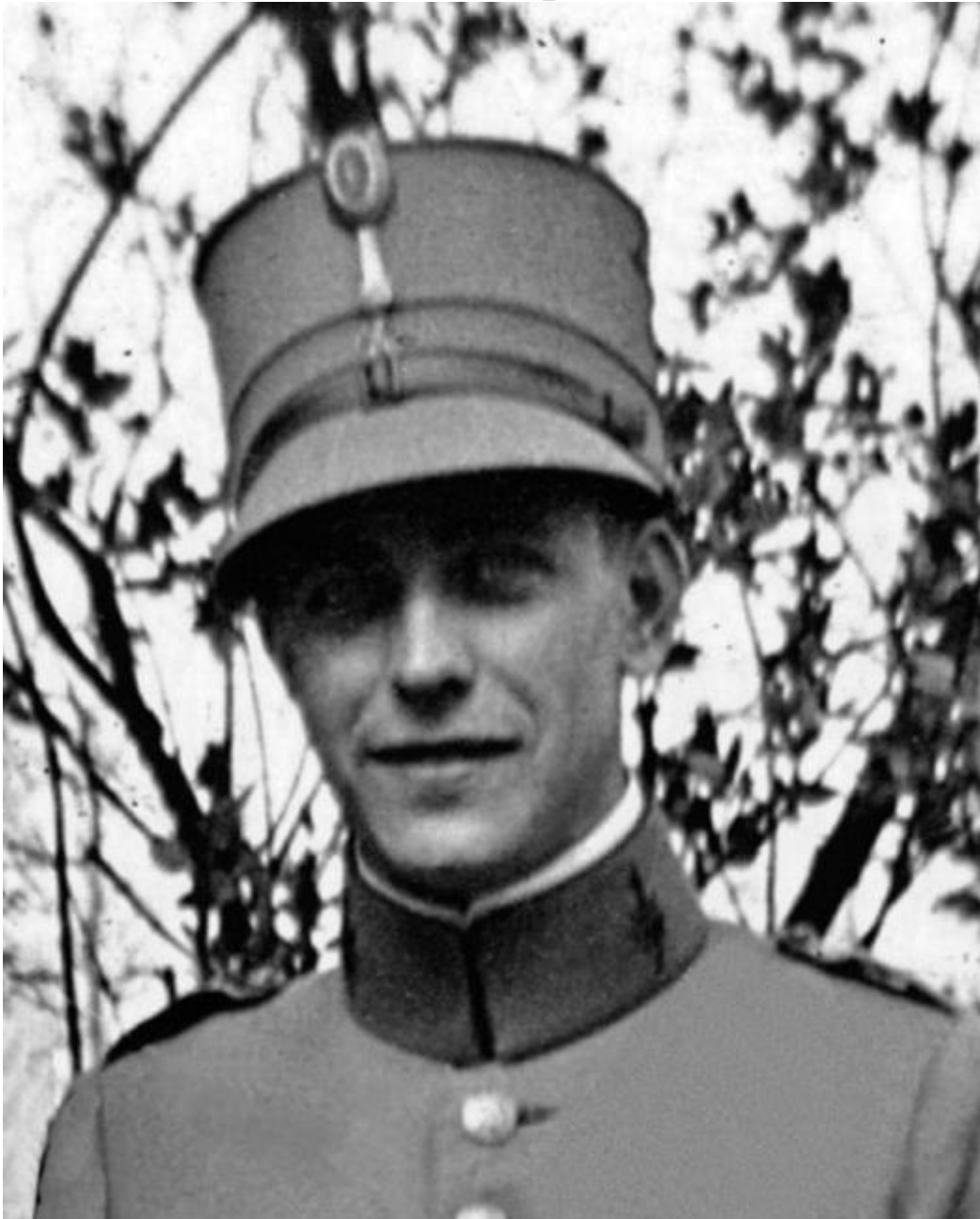
Hein Kuiper

Hein Kuiper komt op 23-jarige leeftijd om het leven aan het begin van de oorlog. Op 10 mei 1940 vliegt hij in Zuid-Holland boven de gemeente Oud Beijerland. Kuiper is op dat moment Boordtelefonist en luchtschutter bij de Koninklijke Luchtmacht en werkt vanaf Schiphol.