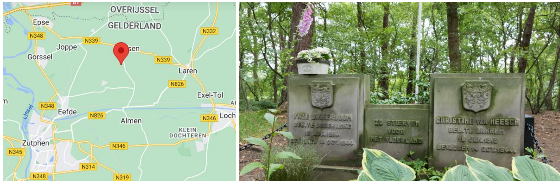
Het Verzetsgraf waar Ynze en Christine samen liggen begraven

Vóór hun vertrek gooiden de overvallers nog enige handgranaten in het Hol [...]. Vermoedelijk hierdoor en de exploderende munitie in het Hol zijn de beide onderduikers om het leven gekomen. Tevens brak er brand uit. Hun schuilplaats werd hun laatste rustplaats, want eind april 1945 na de bevrijding zijn hun stoffelijke overschotten opgegraven en vervolgens aldaar herbegraven .