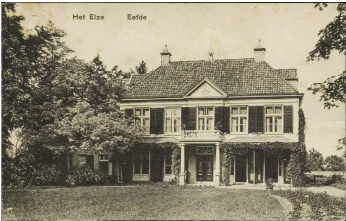
Huize Het Elze

Toen wij opstonden om ongeveer 9 uur hoorden wij veel gemitrailleerd in de richting Elze en Haveke. Later hoorden wij dat bij het Elze 5 Mofen gedood waren, 8 gewond en een 10-tal gevangen.