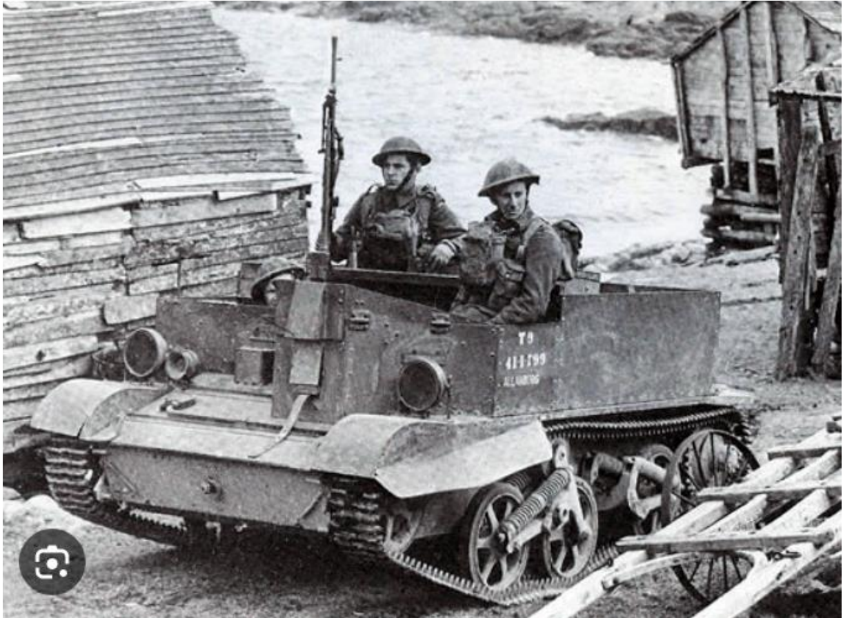
Een Bren Carrier