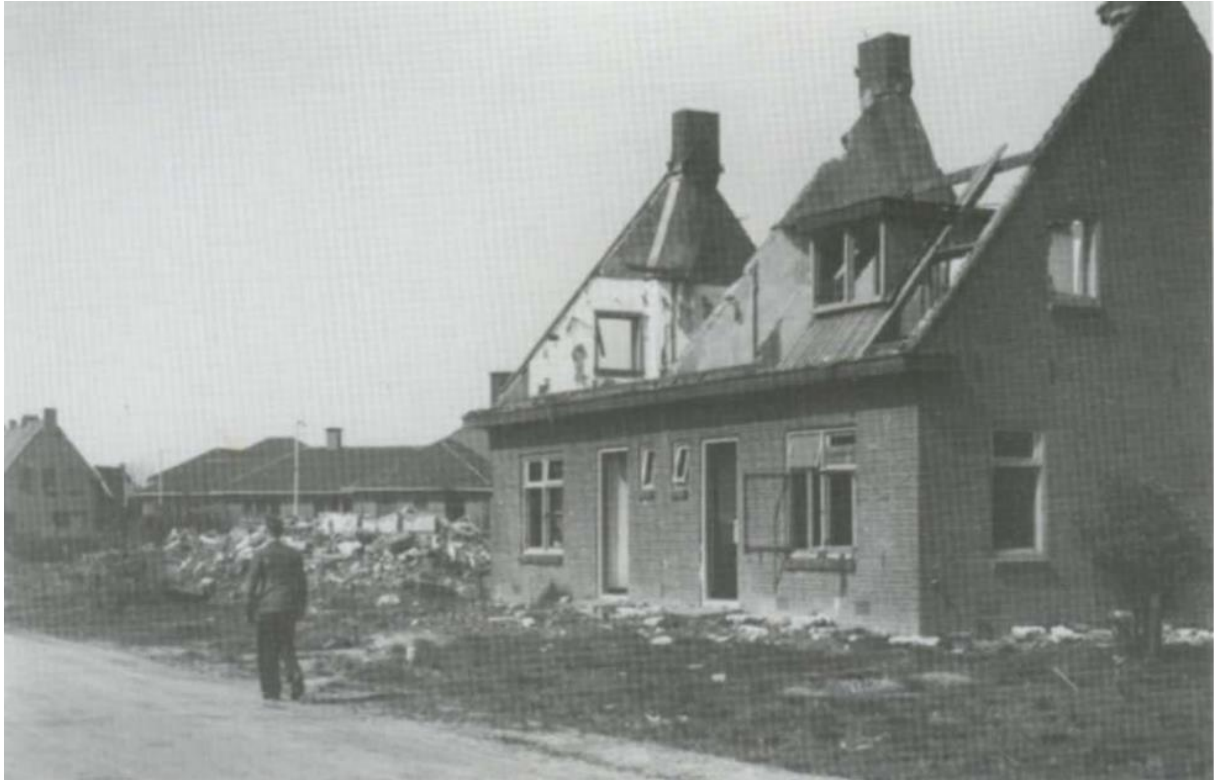
Verwoeste woningen aan de Boedelhofkamp (aan de zijde van de kazerne)