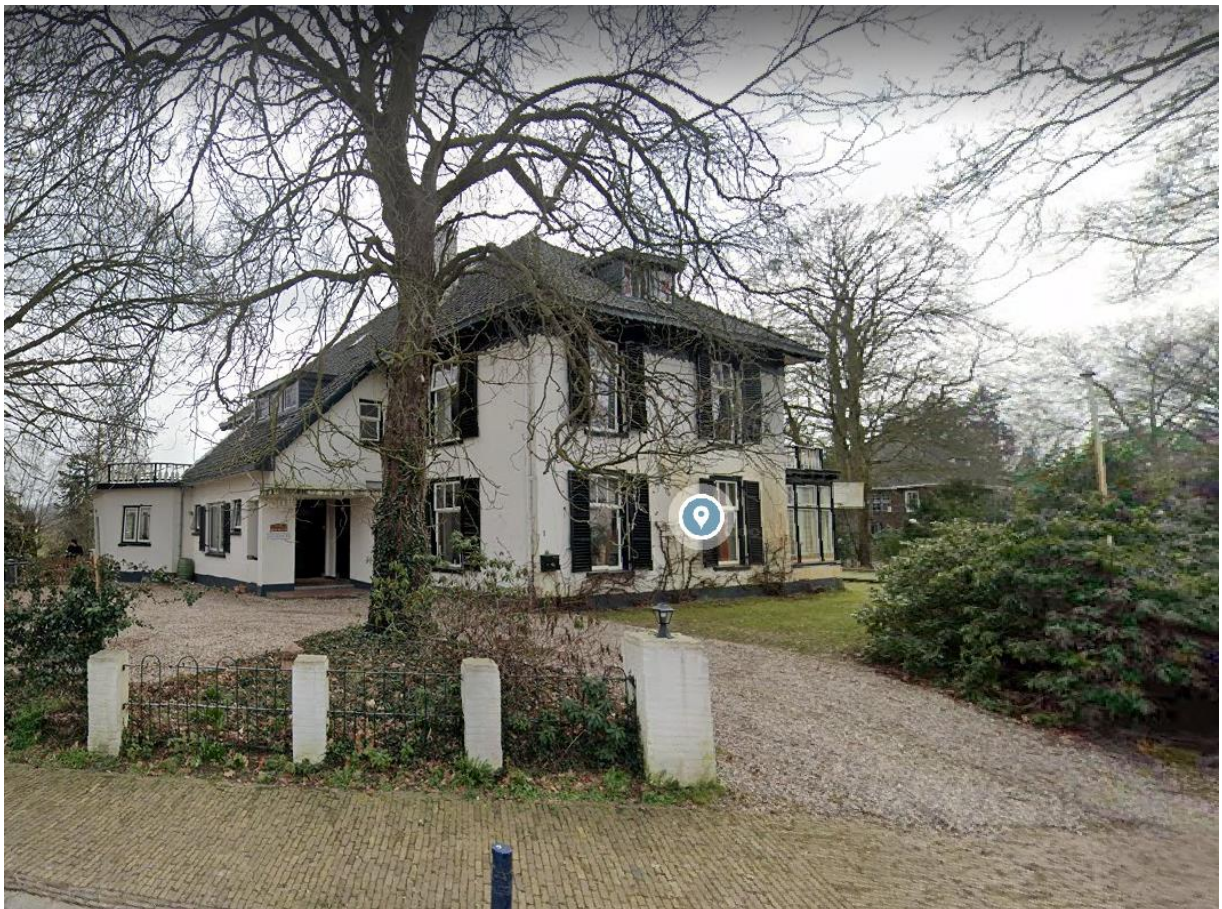
Het doktershuis op de hoek van de 5-sprong