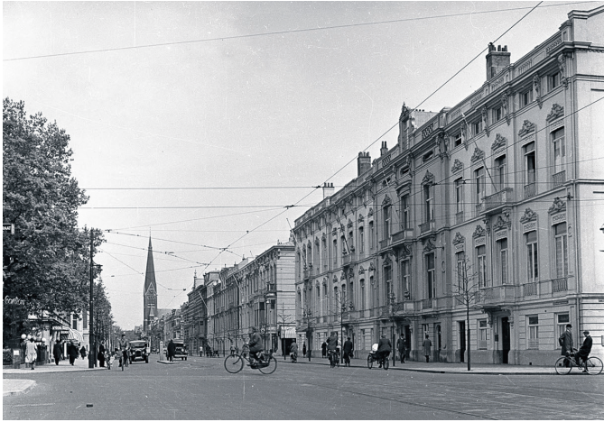
Bezuidenhoutseweg vanaf de Eerste Van den Boschstraat (nu Prins Clauslaan) 1935.

meente had besloten om de Bezuidenhoutseweg tussen de Carel Reinierszkade en een boerderij, de Mariahoeve, te verbreden en van riolering te voorzien. Het zou overigens nog tot het einde van de jaren vijftig van de vorige eeuw duren voordat daar begonnen werd met de aanleg van de wijk die naar deze boerderij werd vernoemd.