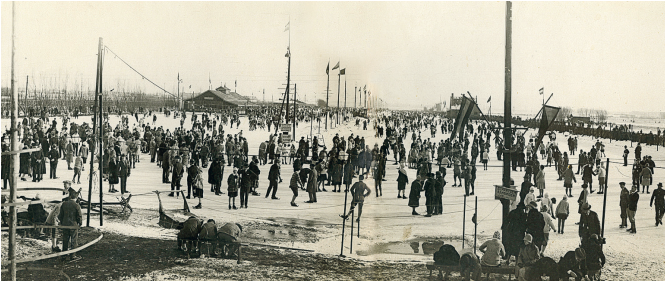
De Haagse IJclub 1929.

schaatsers zich op het ijs wagen. Er werden schaatswedstrijden gehouden. Een imposant nieuw clubgebouw verrees naast de ijsbaan. De ingang werd verlegd naar het verlengde van de Schenkkade tegenover de Nieuwe Veenmolen aan de Schenk. 1 Dat aan de Schenkkade aangelegde stuk kreeg in 1928 de naam IJclubweg.