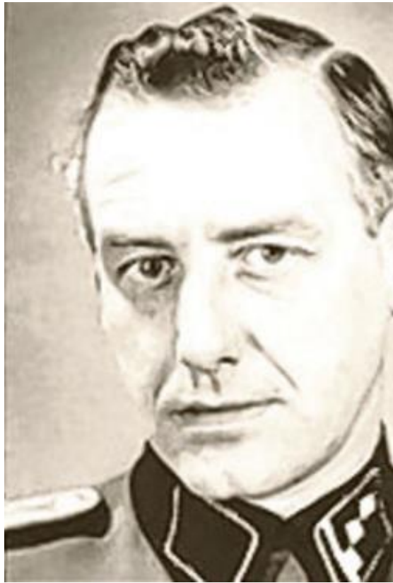
Albert Konrad Gemmeker (1907-1982)