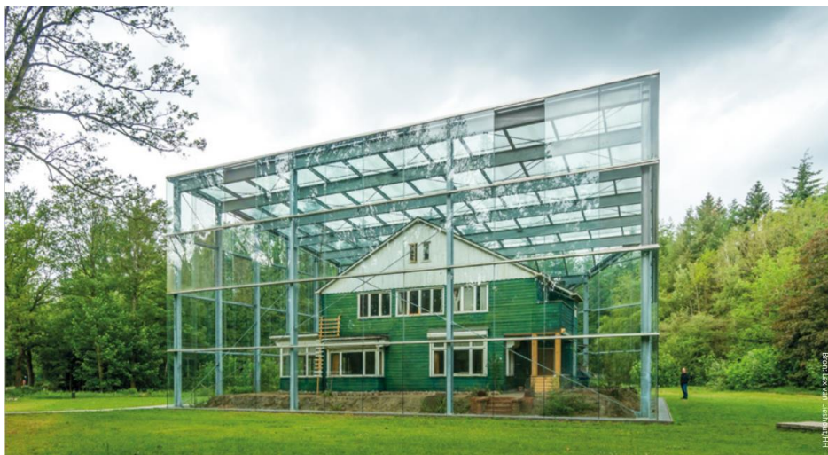
De villa van kampcommandant Gemmeker bij Kamp Westerbork.

'Het onderzoek naar Gemmeker heeft me enorm beziggehouden. Als je niet uitkijkt ben je er 24 uur per dag mee bezig, en dan is het geen leuke figuur om mee op te trekken. Daarom schrijf ik ook in de laatste zin van het boek, dat ik hem met een gevoel van opluchting weer uit mijn werkkamer zal verjagen. Een aantal raadsels blijft natuurlijk bestaan, maar ik weet nu wel veel meer van Gemmeker en ik kan hem nu wel ongeveer plaatsen. Ik heb de afgelopen periode heel veel lezingen over het boek gehouden, maar nu ben ik wel klaar met hem.'