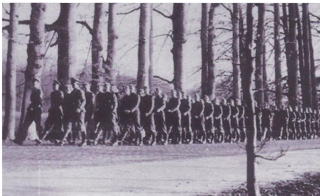
Duitse troepen marcheren over de Middachter Allee

tegen de vijand zouden kunnen worden ingezet. Ze werden respectievelijk gelegerd in Velp: SS-Sanitäts Abteilung 9, Rheden: SS-Panzer Grenadier Regiment 20, Dieren: SS-Panzer Artillerie Regiment 9 en SS-Flak Abteilung 9 en Laag-Soeren: SS-Panzer Pionier Abteilung 9. Het dichterbij komen van het front had ook invloed op de bezetting van Avegoor. De vrouwen en kinderen van de in het SS-Ausbildungslager werkzame militairen, die in de gevorderde huizen in Ellecom woonden, vertrokken met GTM-bussen naar Duitsland. De militairen bleven achter. Daarnaast werd besloten het SS-Ausbildungslager Avegoor te verplaatsten naar Hoozevee in Drenthe.