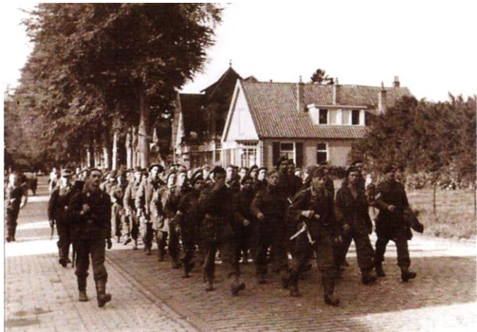
Een groep Engelse soldaten in krijgsgevangenschap die afgevoerd worden tijdens de slag om Arnhem in september 1944. Foto genomen ter hoogte van Villa Irene.

Op 5 augustus 1942 werd Villa Irene gevorderd door de Duitse Wehrmacht en door de S.S. in gebruik genomen als onderdeel van de in 1941 op Avegoor opgerichte S.S. Politie school. Op 3 september arriveerden 139 Joden uit Amsterdam, Rotterdam en Den Haag in Ellecom. Zij werden gehuisvest op de zolder van dit pand en tewerkgesteld bij de aanleg van een sportveld en de bouw van een turnhal achter Avegoor voor de Nederlandse S.S.-rekruten. Onder de Ellecommers kreeg het huis al gauw de bijnaam Huis Palestina, Werkkamp Palestina of gewoon kortweg "Palestina". Het regiem in zowel Kamp Palestina als op Kamp Avegoor was extreem gewelddadig. Er werd geknuppeld en geranseld, de gevangenen kregen weinig te eten en bij ziekte werd soms zelfs helemaal geen eten verstrekt! Van de 139 mannen stierven er, in deze relatief korte verblijfsperiode, drie in Ellecom. Zij liggen begraven op de Ellecoms begraafplaats. 36 Man waren er na zes weken zo erg aan toe, dat zij werden opgenomen in een hospitaal. De rest maakte het karwei uiteindelijk in elf weken af. De mannen werden op 21 november 1942, uitgeput en uitgemergeld, direct op transport naar Westerbork gezet, en na een rustpauze van drie maanden verder op transport naar