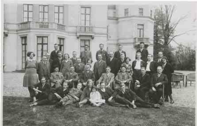
Voor de oorlog was Avegoor in gebruik als 'Troelstra Oord'

Na de Duitse inval in mei 1940 bleef Avegoor onder de