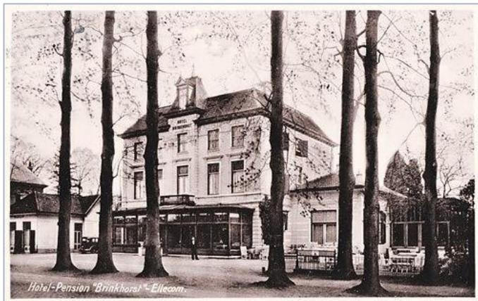
Hotel-Pension Brinkhorst Ellecom 1935