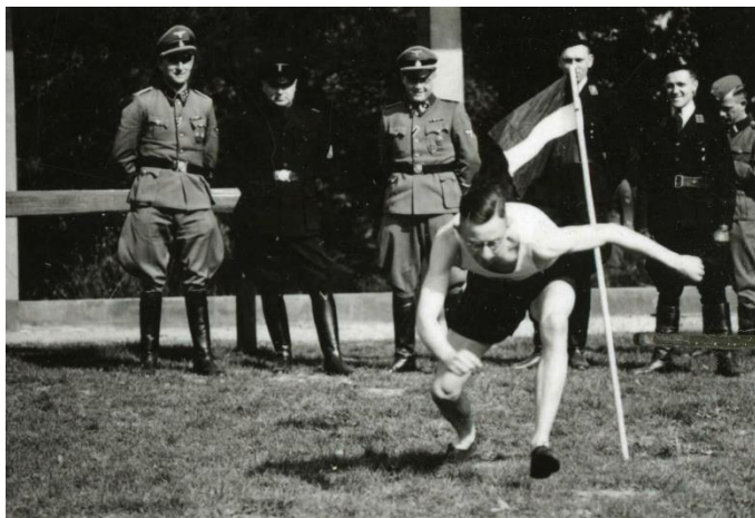
Hoge nazi s bekijken een sport-demonstratie op het door de bewoners van Villa Irene aangelegde sportveld

verworven konden worden. In Avegoor werden vanaf de zomer van 1942 ook een aantal in Nederland woonachtige Duitsers, zogenaamde Rijksduitsers, verplicht een cursus van één maand te volgen. Het ging om alle Rijksduitsers in dienst van de Befehlshaber der Sicherheitspolizei und SD (BdS), onder de 45 jaar, die in staat waren dienst te doen maar nog niet hadden gediend, of nog geen opleiding in Avegoor hadden gevolgd. De mannen werden onder meer ingezet bij het Kamp Amersfoort dat onder de verantwoordelijkheid stond van de BdS, of waren in een andere functie bij de BdS werkzaam. Met dienen, werd onder andere dienst bij de Wehrmacht of Waffen-SS bedoeld. De laatste cursus vond plaats van 31 januari tot 21 februari 1943. Aan het hoofd van de BdS stond SS-Brigadeführer und Generalmajor der Polizei Dr. Wilhelm Harster, de rechterhand van Rauter.