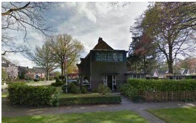
Laan van Athlone 6