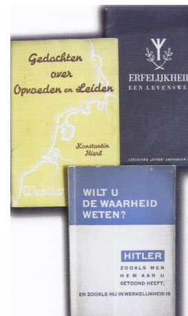
Uit dit soort boeken werd op Avegoor gestudeerd