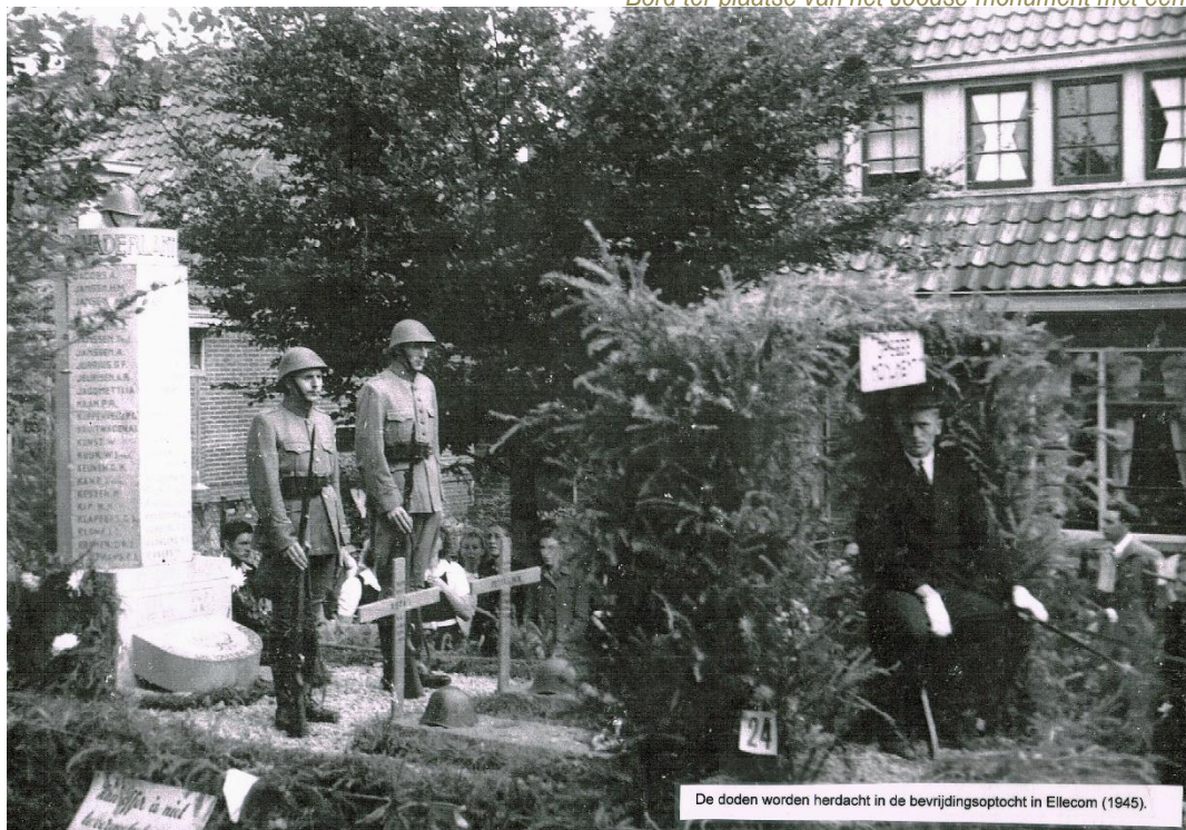
De doden worden herdacht in de bevrijdingsoptocht in Ellecom (1945).

Bord ter plaatse van het Joodse monument met een "in gedachtenis"