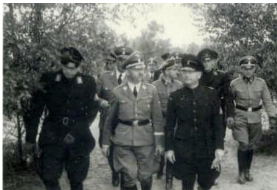
Avegoor bezoek Himmler en Mussert

De eerste weken van april 1945 stonden vooral in het teken van voortdurende geallieerde beschietingen van Duitse stellingen aan de Veluwezoom in verband met de komende bevrijdingsoperatie. Na de oversteek van delen van het 1st Canadian Army en de 49th British "Polar Bear" Infantry Division op 12 april bij Westervoort, werd de Veluwezoom binnen een week bevrijd, waaronder Ellecom op 16 april.