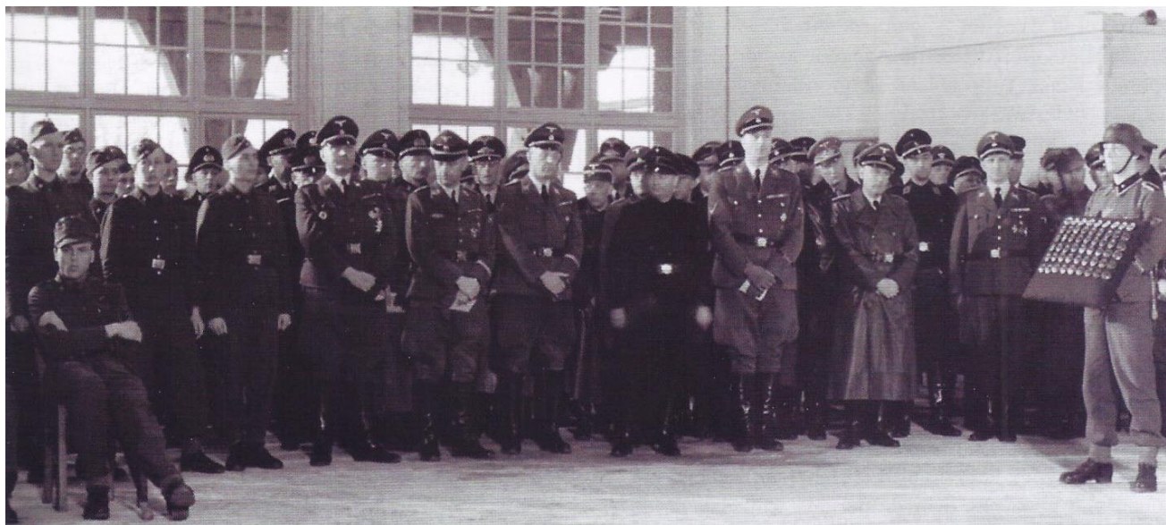
Himmler en Rauter bezoeken Avegoor

Het pand met het toenmalige adres Valkenbergerweg 11 in Rheden werd door militairen van de staf van de divisie gevorderd. Ook in Dieren en Ellecom werden diverse onderdelen van de eenheid gelegerd. Volgens een Albrecht rapport van 24 januari 1945 boden de "Barrakken der Ned. S.S." op Avegoor onderdak aan 100 parachutisten. Op 30 januari volgde de melding dat de Hauptverbandplatz nog steeds in Avegoor gevestigd was en dat er totaal circa 300 parachutisten in Ellecom gestationeerd waren. In de loop van februari/maart verliet de 2. Fallschirmjägerdivision het gebied.