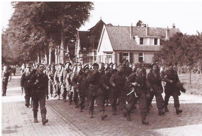
Bij Arnhem en Oosterbeek gevangengenomen Britse para's worden langs Ellecom afgevoerd in krijgsgevangenschap

In en rond het Huis de Valkenberg in Rheden werden artilleristen van de 10. SS-Panzerdivision "Fruntsberg" gelegerd en in Laag-Soeren werden tanks en manschappen van de 9. Panzerdivision ondergebracht.