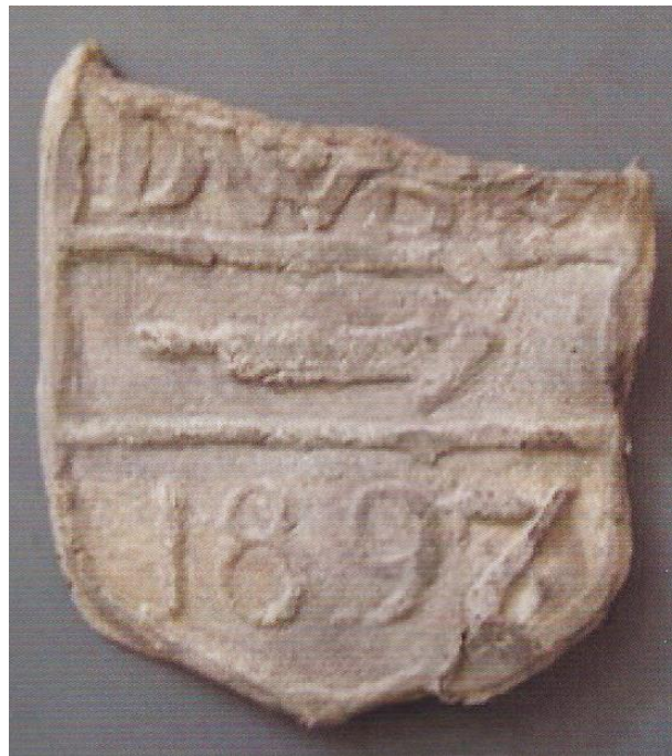
Gevonden loodmerk uit de oorspronkelijke bouwtijd van Villa Irene