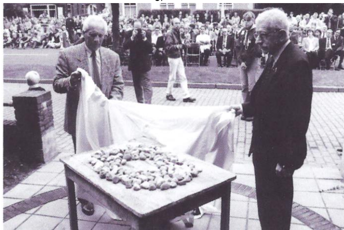
In 1998 werd een monument ter nagedachtenis aan Kamp Palästina onthuld

SS-Schule Avegoor (collectie N756, inventarisnummer 21/ A)