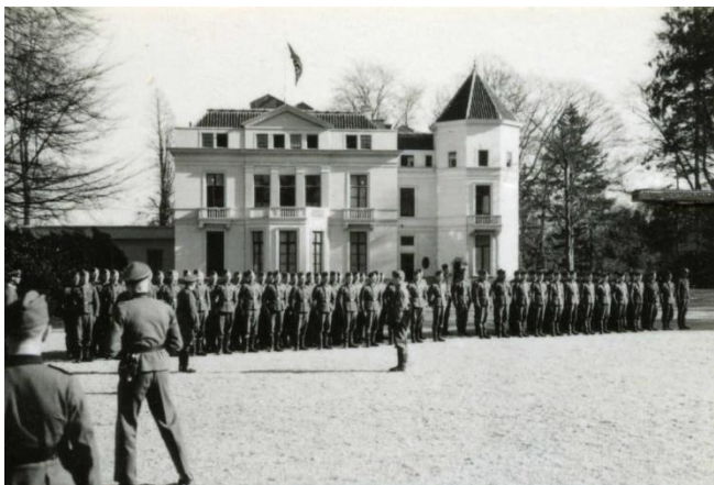
SS-troepen staan aangetreden voor Avegoor

tegen de vijand zouden kunnen worden ingezet. Ze werden respectievelijk gelegerd in Velp: SS-Sanitäts Abteilung 9, Rheden: SS-Panzer Grenadier Regiment 20, Dieren: SS-Panzer Artillerie Regiment 9 en SS-Flak Abteilung 9 en Laag-Soeren: SS-Panzer Pionier Abteilung 9. Het dichterbij komen van het front had ook invloed op de bezetting van Avegoor. De vrouwen en kinderen van de in het SS-Ausbildungslager werkzame militairen, die in de gevorderde huizen in Ellecom woonden, vertrokken met GTM-bussen naar Duitsland. De militairen bleven achter. Daarnaast werd besloten het SS-Ausbildungslager Avegoor te verplaatsten naar Hoozevee in Drenthe.