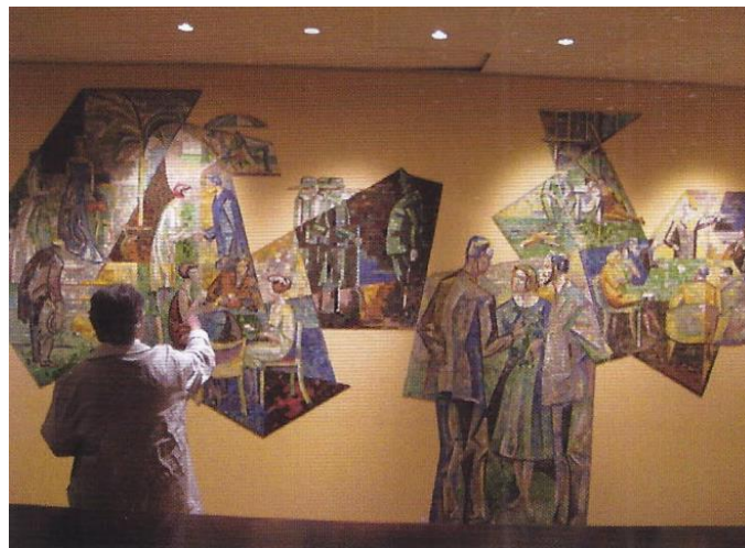
Een mozaïek herinnert nog aan het gebruik van het Avegoor in de oorlogsjaren