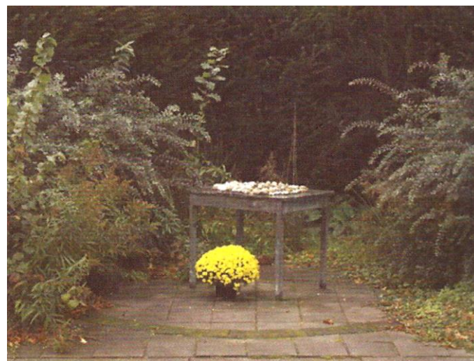
Joods monument ter nagedachtenis aan de omgekomen dwangarbeiders.

Een monument van kunstenaar Harry de Leeuw ter nagedachtenis aan de omgekomen dwangarbeiders werd op 6 september 1995 op het terrein van Villa Irene onthuld. Het is een in brons gegoten oude tafel, destijds door de vertrekkende gevangenen als groet aan de drie overleden lotgenoten achtergelaten met daarop volgens joodse traditie 136 alhier gevonden stenen. Bij een verbouwing in 1953, het huis was inmiddels weer teruggegeven aan de eigenaren, werd de villa gesplitst in een boven- en benedenwoning. In 1975 werd het eigendom van de villa door de familie van Heeckeren van Wassenaer in de Stichting Twickel te Ambt-Delden ingebracht. Enige jaren geleden is het huis door de Stichting Twickel verkocht aan Rentmeesterkantoor Korevaar en als bedrijfsruimte in gebruik.