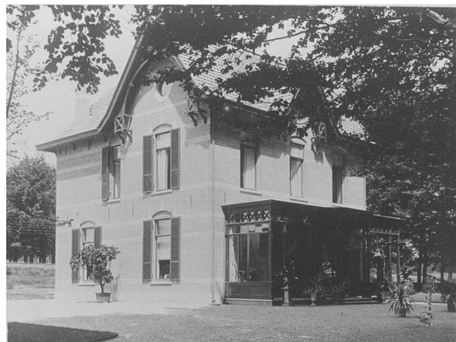
De hel van Ellecom villa Irene/ kamp Palestina

Al vanaf 1942 werd Avegoor ook gebruik als opleidingskamp voor Nederlandse vrijwilligers voor de Waffen-SS. Naast sport en militaire opleiding kregen de mannen les in de Duitse taal, geschiedenis, aardrijkskunde en "Deutschtumkunde". De wereldbeschouwelijke scholing bleef aan de basis staan van de opleiding. Daarnaast werden speciale sportopleidingen verzorgd waarmee het SS-Sportabzeichen en de Germanische Leistungsrune