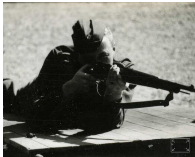
SS-soldaat in opleiding oefent in het terrein Avegoor.

In de Hauptverbandplatz in Avegoor moesten in de eerste weken van oktober 1944 vele gewonden zijn verzorgd. Vanaf 2 oktober tot en met 10 oktober werden op de Ellecomse begraafplaats aan de overzijde van het spoor 22 overleden Duitse militairen van diverse eenheden begraven. Op 2 oktober ging het hierbij om totaal negen militairen van het Panzer Grenadier Regiment 156 (infanteristen), de Panzer Abteilung 506 (Tiger II tanks), de Panzer Jäger Abteilung 50 (pantserafweer kanonnen) en andere legeronderdelen, die onder andere bij De Laar, Elden en Aam (bij Elst) werden ingezet.