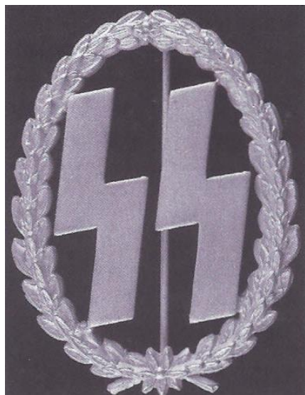
Een op Avegoor uitgereikte SS-Leistungsrune

Een onderscheiding die volgens een krantenartikel uit die tijd werd uitgereikt aan mannen die "aan de veelzijdige eischen voldoen, die voor 't verwerven van de Leistungsrune gesteld worden, en niet slechts op het terrein van de "Wehrsport" liggen, doch ook op het gebied der nationaalsocialistische wereldbeschouwing".