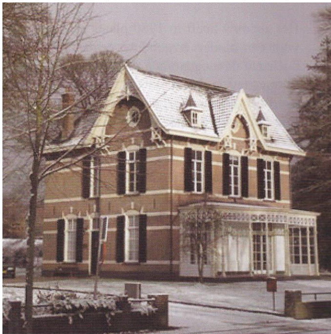
Villa Irene, voor/zijaanzicht omstreeks 1985