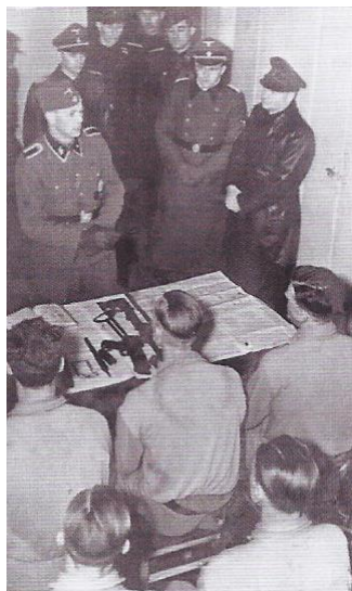
School bezoek Himmler aan SS-Opleiding

weken duurden, werden de cursisten in het uniform van de Waffen-SS gehesen en was ook een volledige lichte infanterie opleiding opgenomen, maar deze was niet bedoeld als militaire training voor dienst aan het front. Naast de fysieke componenten van de opleiding werden door verschillende sprekers diverse voordrachten gehouden met onderwerpen als,