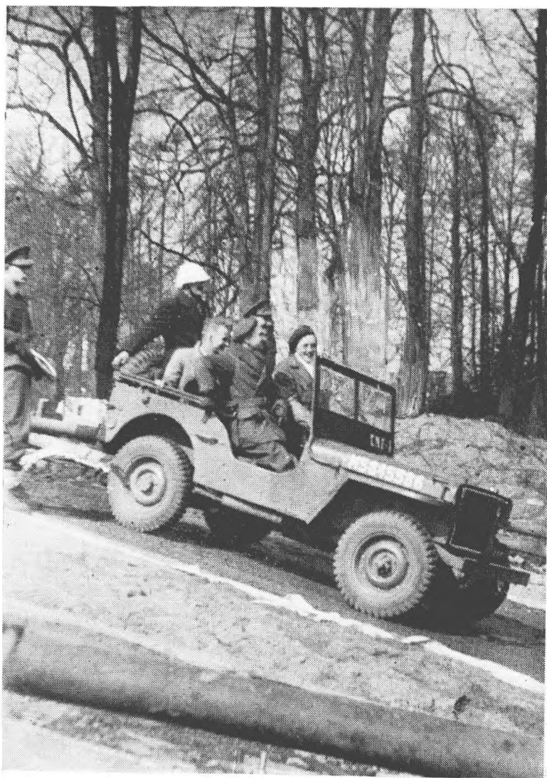
Prins Bernhard op de vernielde Deventerwegbrug.