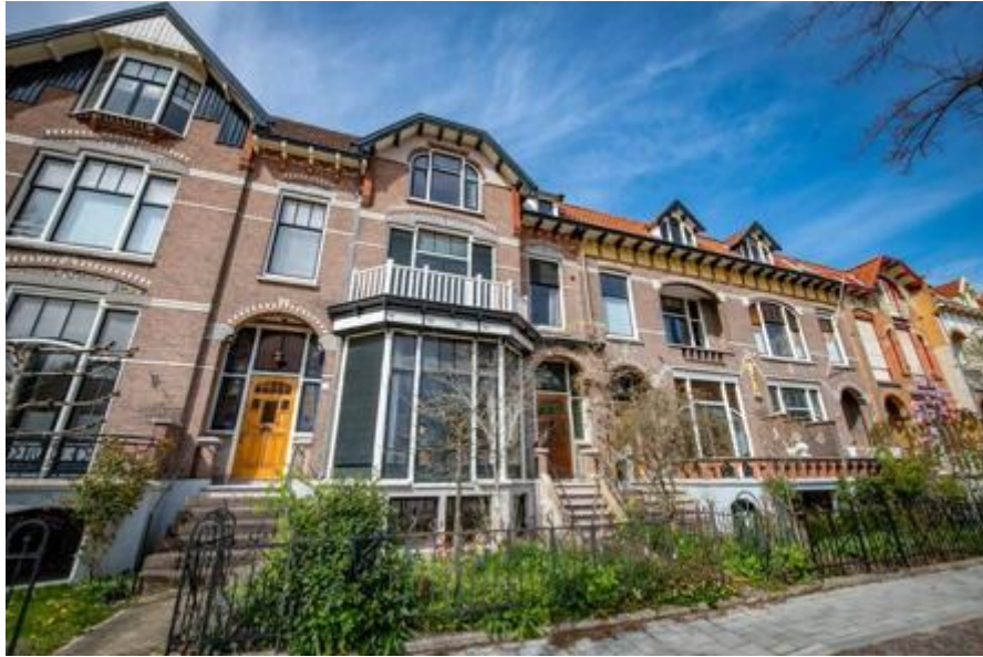
Een van de afgepakte woningen tijdens de Tweede Wereldoorlog. Deze is in 1949 weer terug bij de Joodse familie Vromen gekomen.

afgepakte huizen, maar óók over de Joden die daar woonden en hoe het met hen is afgelopen tijdens of na de oorlog. De bedoeling is dat alle informatie over Joodse gezinnen die hier aan elkaar gekoppeld is, voor iedereen te vinden is.