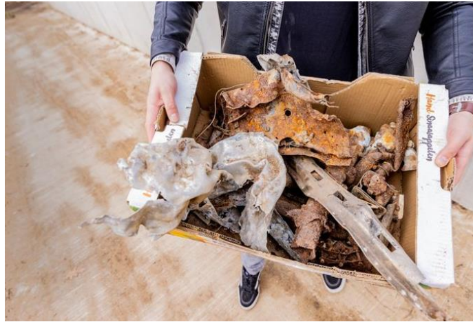
Een deel van de gevonden resten.