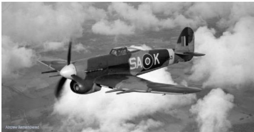
Het vliegtuigtype van Cammock

Katsjoek-katsjoek. Achter hun boerderij hoort en ziet hij de cadans van een trein. Het geluid vermengt zich met vliegtuiggebrom. Trrr, trrr. Opnieuw schoten. Vanaf de grond vuurt iemand op een vliegtuig hoog aan de hemel. Boem: na een paar salvo's is het raak. Als een dood vogeltje hangt de bolide nog even in de blauw witte lucht, dan stort het loodrecht richting het spoor.