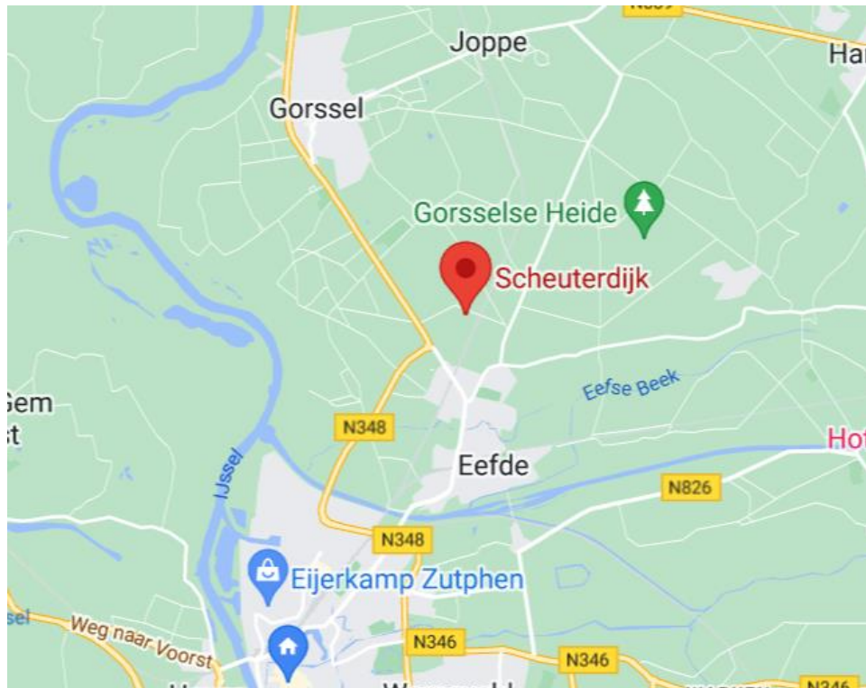
De Scheuterdijk in Eefde