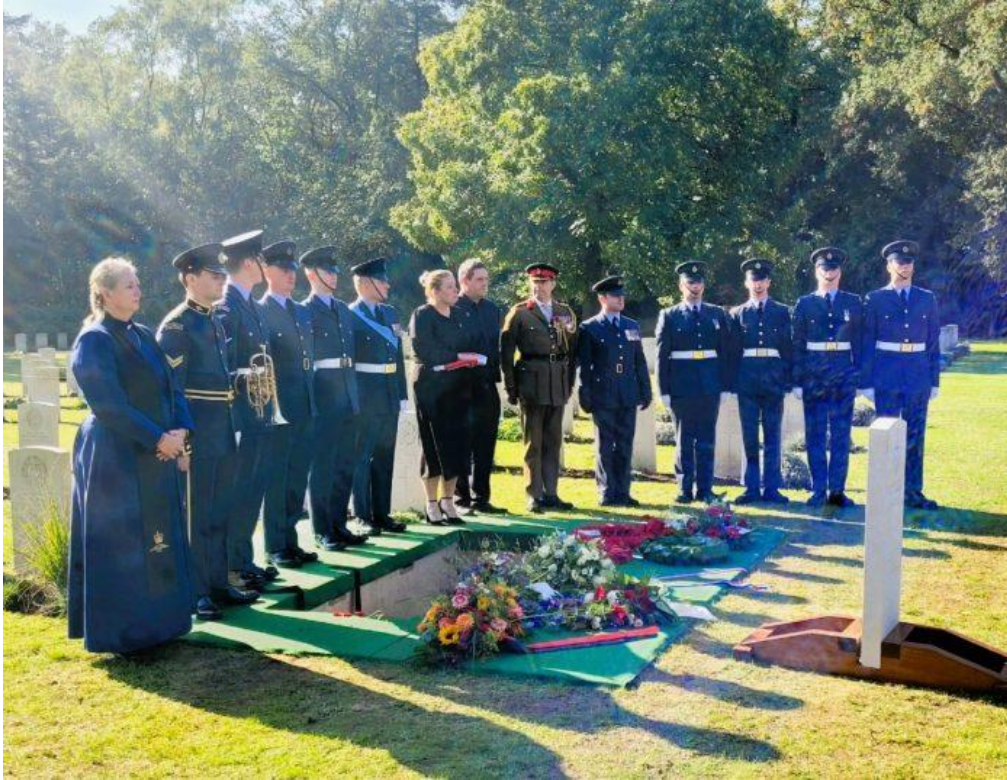
Beeld van de begrafenis op begraafplaats Jonkerbos in Nijmegen