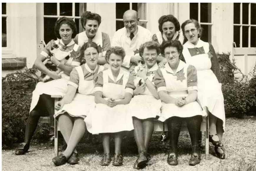
Personeel van het Joodse psychiatrisch ziekenhuis het Apeldoornse Bosch vlak voordat ze samen met hun patiënten werden gedeporteerd, 1942

plekken van de oorlog. En zonder de duisternis te kennen, kun je het licht en vrijheid niet op waarde schatten. Deze locaties zijn ‘maantekens’, een omschrijving die is afgeleid van het werkwoord ‘vermanen’. Zoals de Duitse term Mahnmal. Dit zijn geen monumenten om te vieren, maar waarschuwingen. Heel belangrijk juist in deze tijd met toenemend antisemitisme [..].”