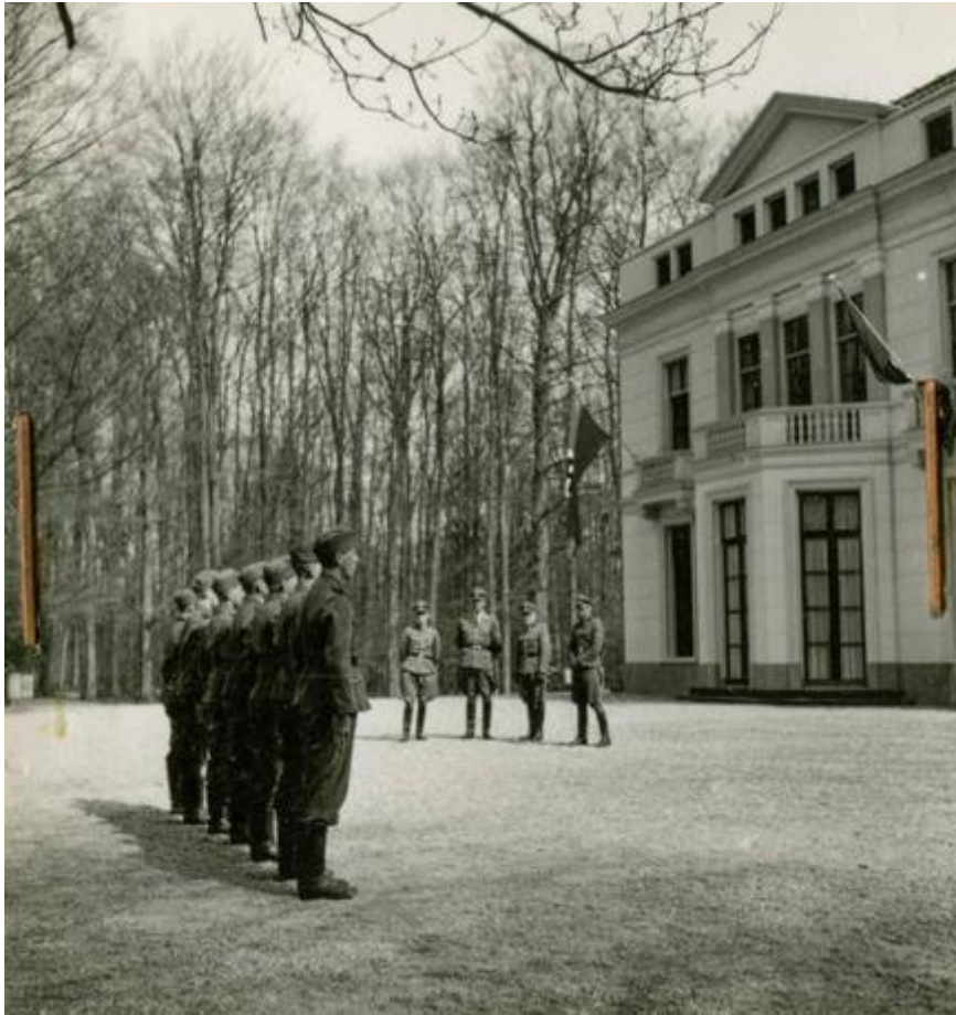
SS-opleiding op Landgoed Avegoor in Ellecom

Er zijn veel Gelderse NSB-locaties, zoals het voormalig Troelstra-oord bij Apeldoorn, waar een groot propagandakamp is gehouden. De enige twee NSB-kindertehuizen werden in Nijmegen (De Westerhelling) en Ellecom (De Oosterhelling) opgericht. Verder opende de Nationaal-Socialistische Vrouwenorganisatie in Arnhem een NSB-moederschool en hield de partij regelmatig bijeenkomsten in het Nijmeegse concertgebouw De Vereeniging.