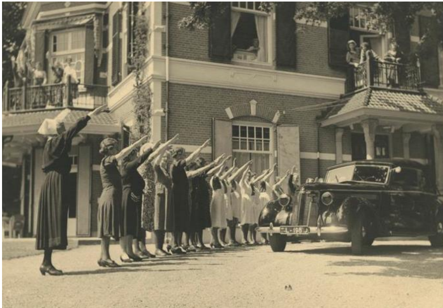
Westerhelling, het kindertehuis te Nijmegen dat op 1 augustus 1941 door de NSB in gebruik werd genomen.