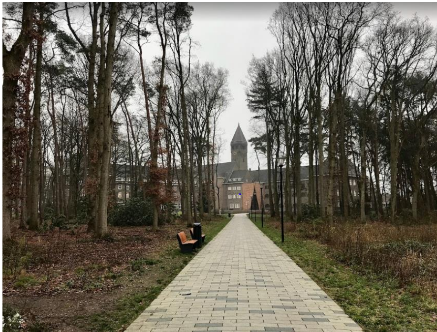
Het als Lebensborn-kliniek ingerichte Berchmanianum, voormalig college en kloosterverblijf van de Sociëteit van Jezus in Nijmegen

Pas in 1996 vertelden enkele hoogbejaarde jezuïeten aan dagblad Trouw over hun vondst destijds. Lange tijd hadden ze er niet over willen praten. Te beschamend. Te pijnlijk [..].