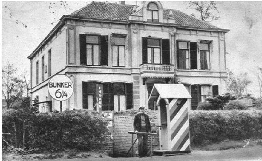
Het voormalige buitenverblijf en de bunker van Arthur Seyss-Inquart. Seyss-Inquart in Apeldoorn

kwelijk, anderzijds trekken ze de geschiedenis naar het hier en nu en bieden ze, zeker voor een jong publiek, aanknopingspunten voor gesprekken over discriminatie.”