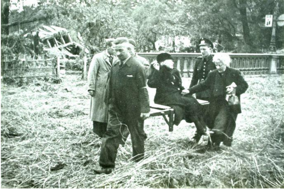
Per brancard dragen hulpverleners een vrouw over de toenmalige Pont Neuf, een brug over de Berkel. Het hooi is afkomstig van de stadsboerderij