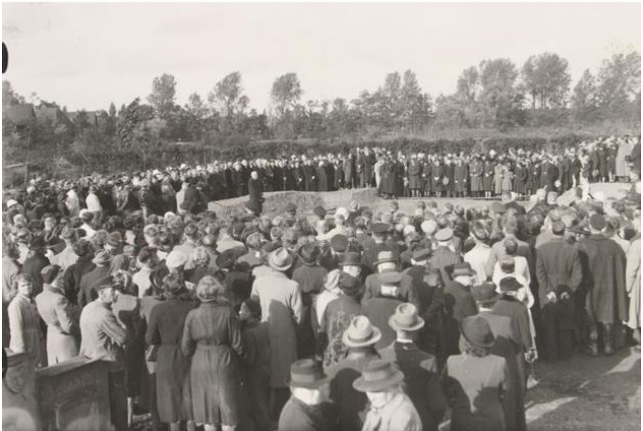
Zutphen rouwde massaal toen de slachtoffers werden begraven.