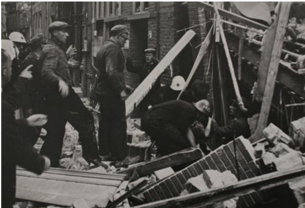
Hulpverleners halen hier in de Barlheze een paar weken daarvoor getrouwde vrouw, dood uit het puin.