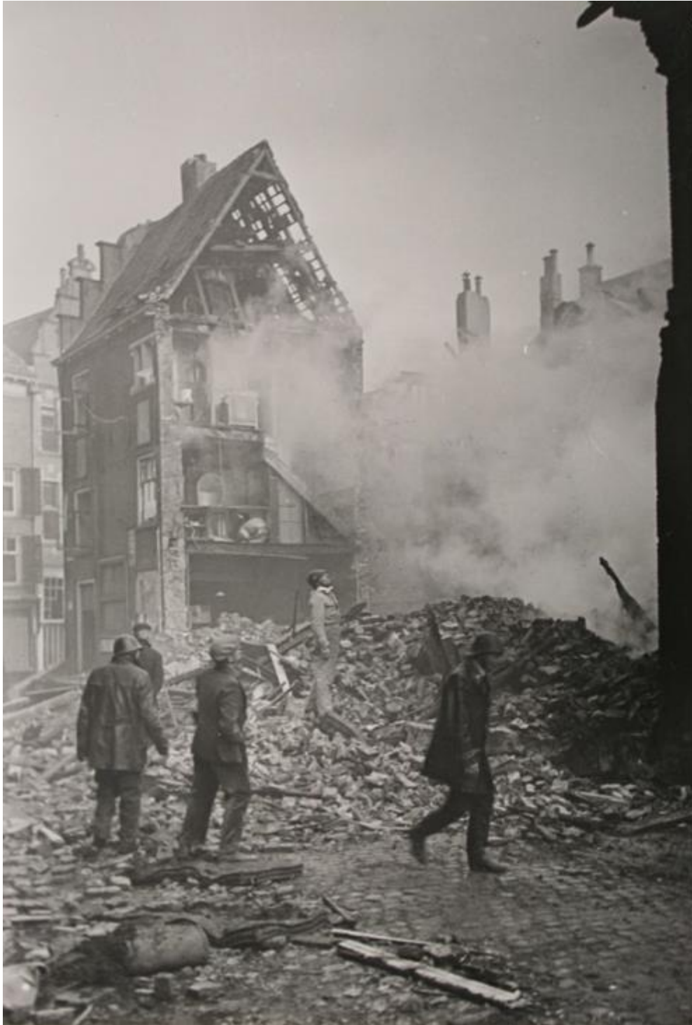
In de Waterstraat, aan de andere kant van het centrum werden veel panden verwoest.