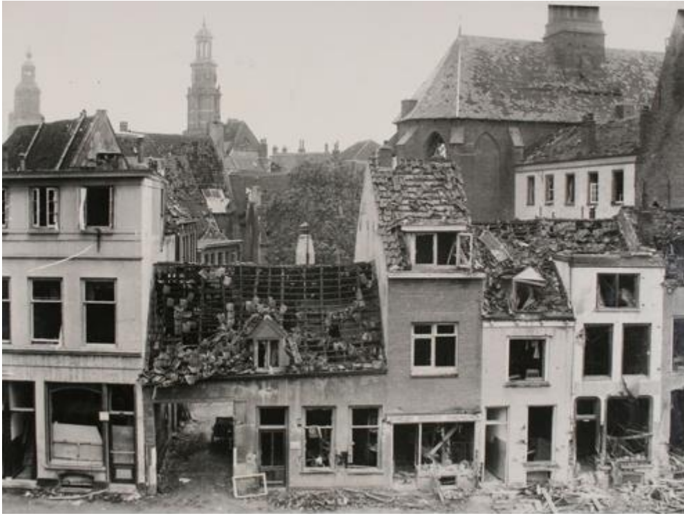
Zwaar beschadigde panden aan de Rozengracht.