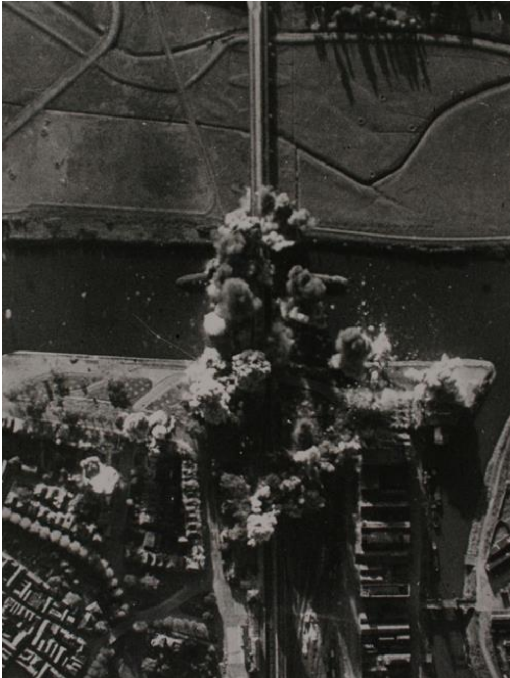
De bommen vallen op het noordwestelijk deel van de binnenstad en raken de IJsselbrug nauwelijks.