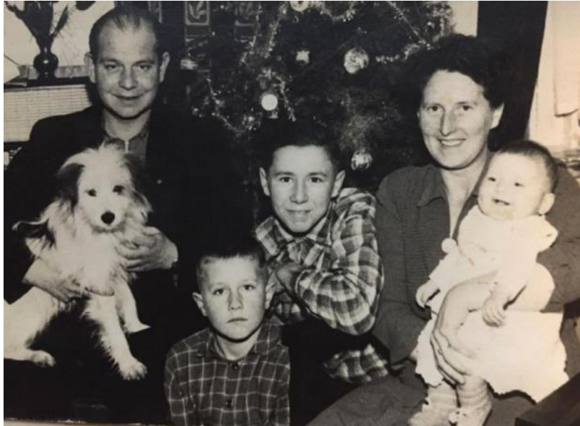
Prive foto's Joop Scholten © Joop Scholten

Verward vroeg hij het later zijn moeder. „Ze verwees naar mijn vader. Voor mij was het een enorme opluchting. Het was mijn bevrijding. Ik kon alle ellende op Scholten gooien. Mijn faalangst, mijn gebrek aan zelfvertrouwen, het bedplassen, mijn slechte zelfbeeld. Hij had niets meer te zeggen over mij.”