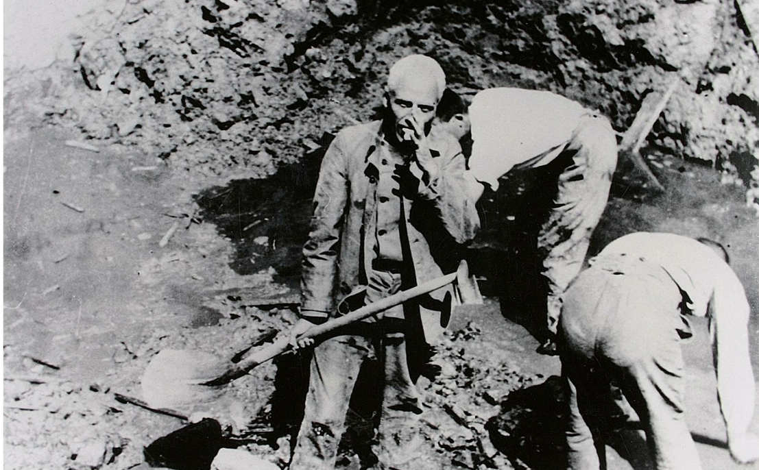
STEDELIJK MUSEUM ZUTPHEN

Tesebeld werd na zijn arrestatie ook gedwongen om in de Barlheze te helpen zoeken naar, nog vermiste, slachtoffers van het bombardement van 14 oktober 1944.