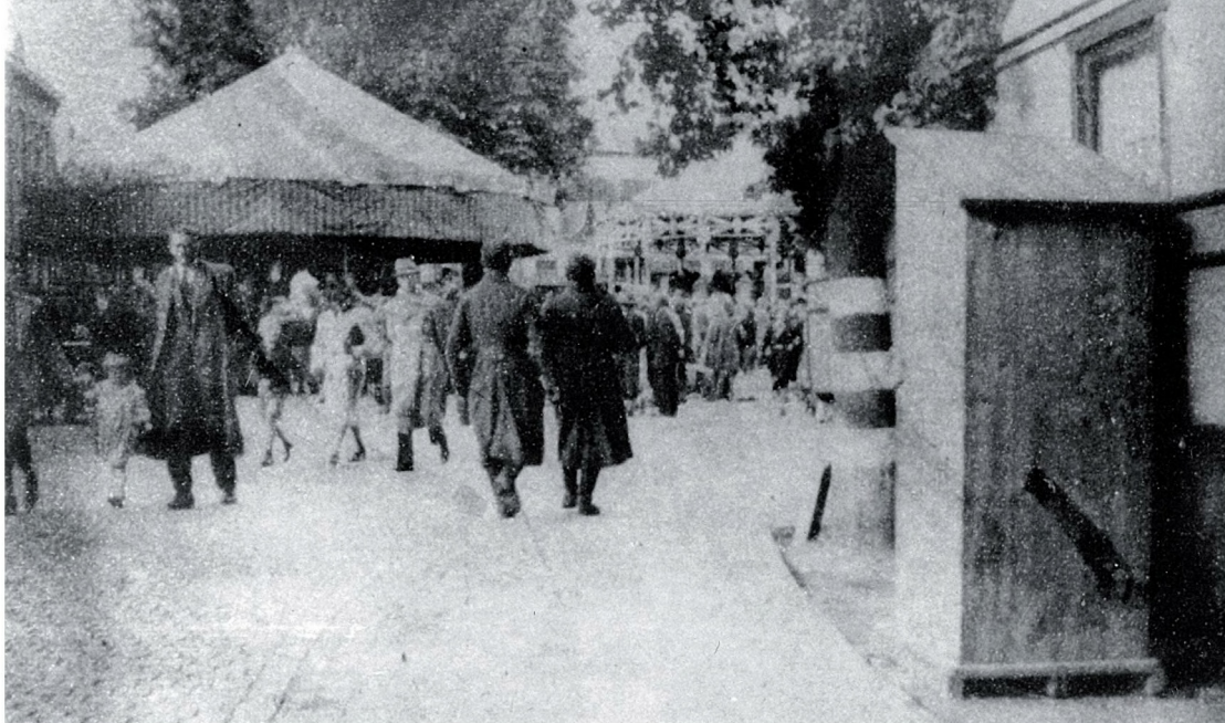
STEDELIJK MUSEUM ZUTPHEN