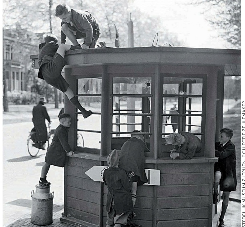
STEDELIJK MUSEUM ZUTPHEN, COLLECTIE ZEULEMAKER

Tesebelds bestuurlijke ambitie bleek in 1942 toen hij deelnam aan de burgemeesterscursus van de NSB. Deze cursus was opgezet om NSB-leden klaar te stomen burgemeestersposten over te nemen. Zittende burgemeesters beschreven het cursusprogramma als ‘om te lachen’ omdat het een schriftelijke opleiding betrof die drie maanden duurde en werd afgesloten met een mondeling examen en een reis naar Duitsland. 7 Het is onbekend met wat voor cijfers Tesebeld de cursus heeft voltooid. Een medecursist beschreef Tesebeld in een rapport als een zelfvoldane praatjesmaker die zich naar ‘boven anders