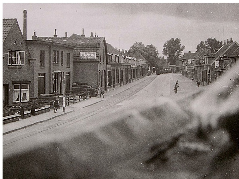
STEDELIJK MUSEUM ZUTPHEN

Dolle Dinsdag: De stoomtram, met daarin de vluchtende NSB-ers en andere Duitsgezinden, is hier stiekem gefotografeerd vanuit de dakgoot van een huis aan de Emmerikseweg. Waarschijnlijk zat ook Tesebeld in de tram.