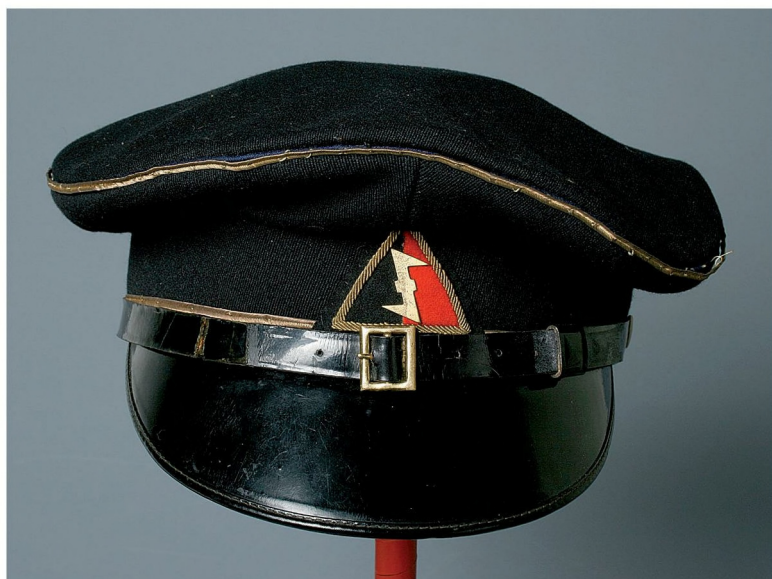
STEDELIJK MUSEUM ZUTPHEN