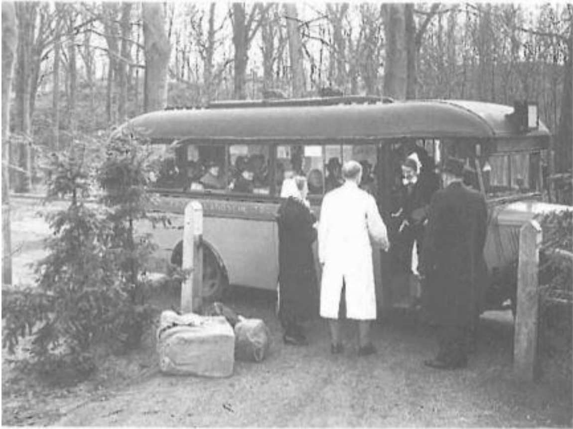
Aankomst van patiënten

In het ONG was het vol en benauwd. Er ontstonden irritaties over en weer tussen de artsen over de ruimte voor hun patiënten. Bovendien was het niet zo veilig als gedacht werd.