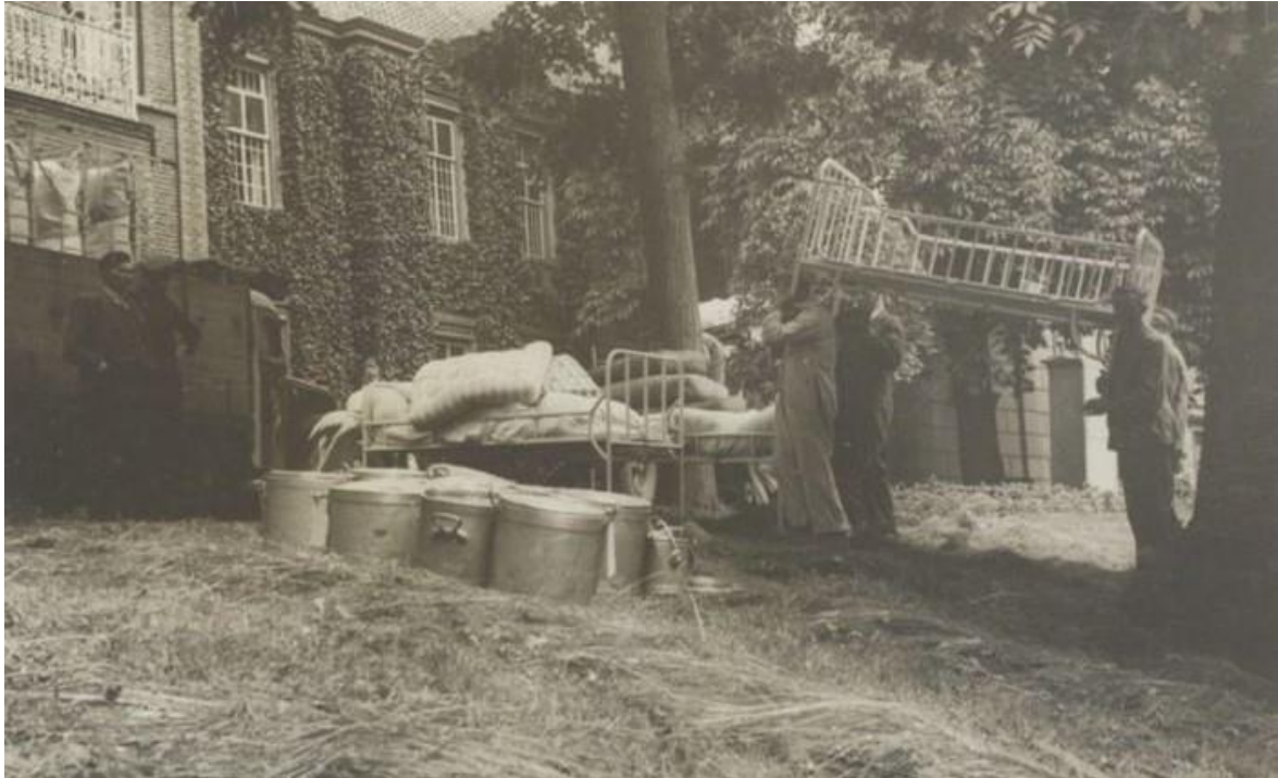
De primitieve verhuizing naar een reeds overvolle Groot Gaffel

Op 16 februari 1943 gingen 170 patiënten van de Stichting Rosenberg te Loosduinen bij Den Haag en 60 personeelsleden naar het Oude en Nieuwe Gasthuis (ONG) te Zutphen en Groot Gaffel te Warnsveld. Dit eeuwenoude ziekenhuis nam vanaf 1840 ook psychiatrische patiënten op.