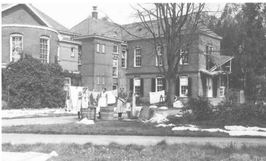
De was hangt buiten tijdens de laatste dagen van de oorlog

De meeste patiënten liepen in groepjes van vijf onder begeleiding van personeel. De bedlegerigen werden vervoerd per ziekenauto, per vrachtwagens met brancards, met een wagen van het Rode Kruis of met rijwielbrancards.