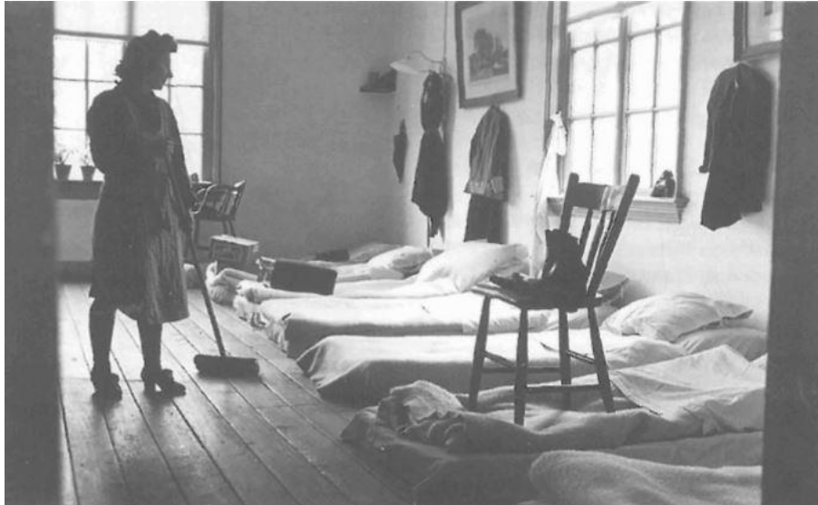
Voor de matrassen waren er geen bedden meer

Op 28 september 1944 ontplofte een munitietrein op het station te Zutphen. De schade aan het Binnengesticht was groot en één patiënt werd dodelijk getroffen. Vanwege verder gevaar besloten de directies van de ziekenhuizen bijna alle patiënten met personeel over te brengen naar Groot Gaffel.